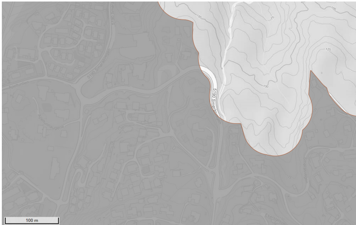
Figur 3: Kartutsnitt frå Statistisk sentralbyrå (kart.ssb.no). Dei mørkegrå områda er definert som tettstadar i 2020.

Heile delen av tidlegare trasé for fv. 5190 Smøråsvegen ligg i tettbygd område med over 5000 innbyggjarar ut frå kart til Statistisk sentralbyrå over tettstader for 2020. Etter grensedraging mellom kommunale og fylkeskommunale vegar er det dermed punkt a. som vil vere gjeldande.