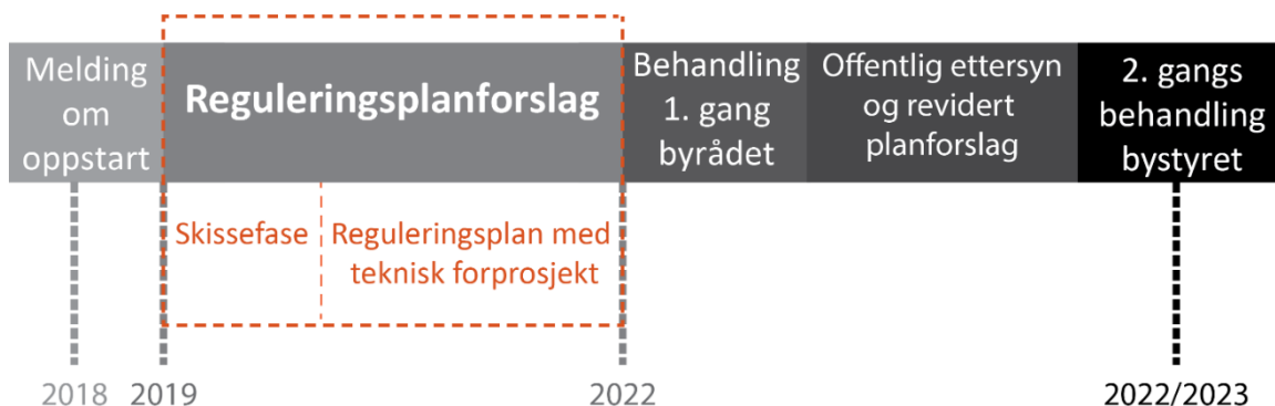
Tabell 1. Framdriftsplan reguleringsplanarbeidet

Forlenging av Fløyfjellstunnelen (begge løp) heng tett saman med bybaneutbygginga ettersom dette mogleggjer prioritering av bane, sykkel og lokalveg i Åsanevegen. Tunnelen er planlagt forlengta med ca. 2,8 km, slik at ny lengde på tunnelen vil verte 5,3 km. Med mål om kontinuerleg utbygging vert det utarbeidd ein forenkla reguleringsplan for ein førebuande entreprise for den forlengta Fløyfjellstunnelen.