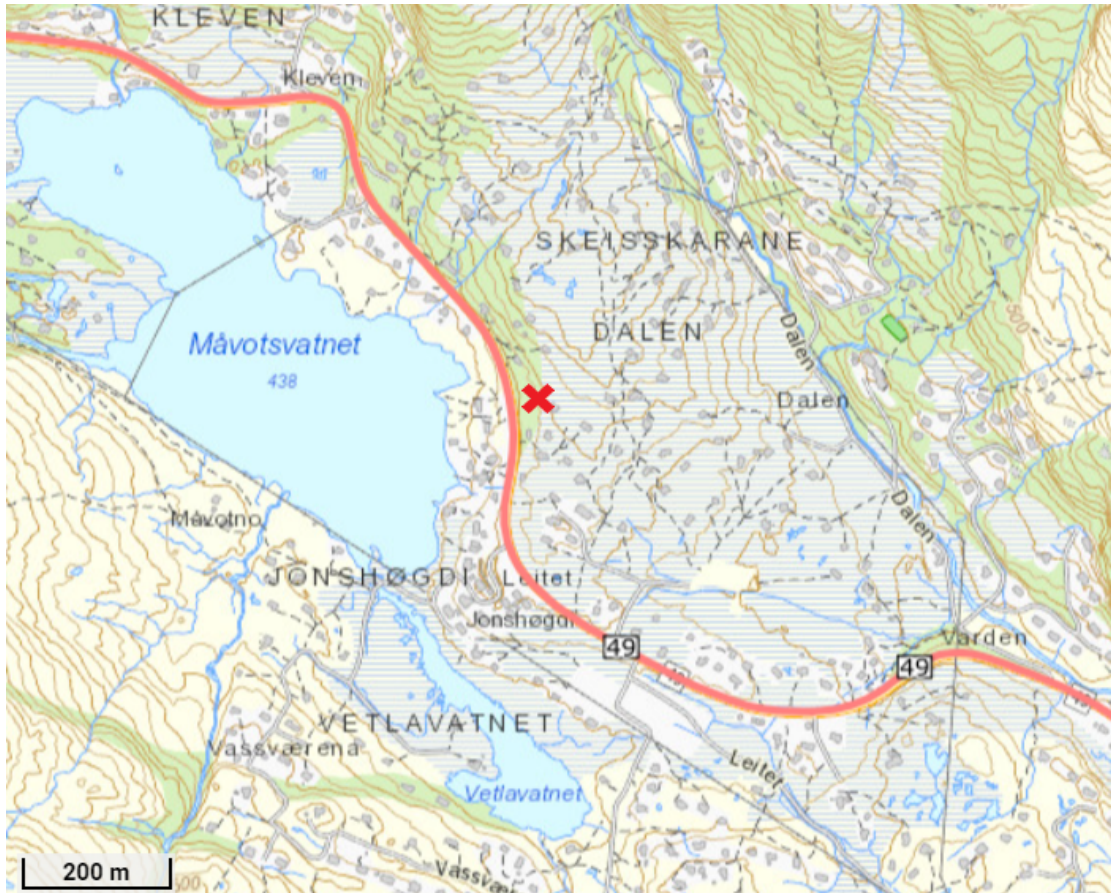
Figur 1: Plassering av hytte på gnr. 19 bnr. 319.