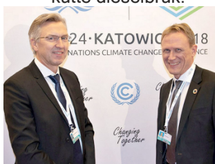
Figur 1 Fjordkraft fikk FN pris for sitt Klimajaro-prosjekt om å stille miljøkrav til leverandørar