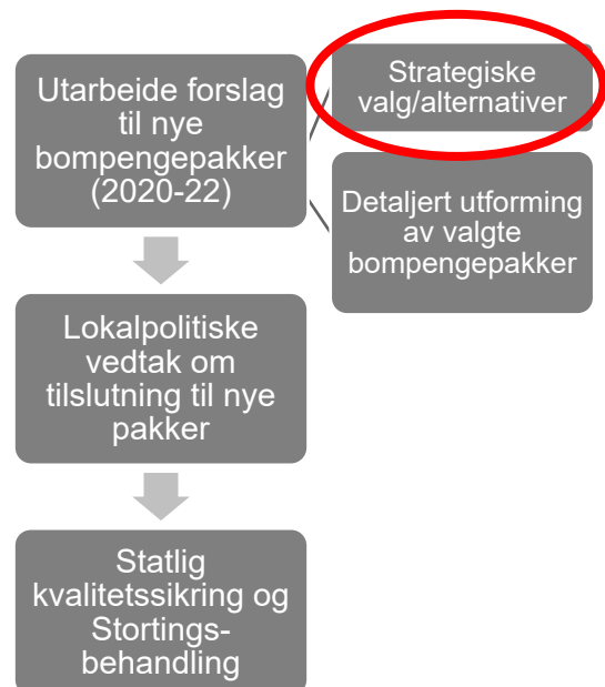
Figur: Prosessen for nye bompengepakkar på Haugalandet. Hausten 2021 har det vore ei høyring om strategiske val for nye bompengepakkar på Haugalandet.

Fylkestinga sine vedtak i desember avgjer kva for pakkar fylkeskommunane og kommunane skal gå vidare med. Når pakkane etter dette blir utforma meir detaljert, skal dei skildre mål og prinsipp for prioritering, kva for prosjekt som er aktuelle, kostnader og finansieringsgrunnlag, takstnivå og innkrevingssystem mv. I tillegg må hovudprosjektet i kvar pakke regulerast og kostnadsvurderast.