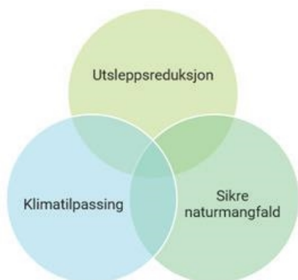
Figur 2: Hovudområda i Klimaomstilling

tilpassar oss til dagens og framtida sitt klima. Ein del av arbeidet med redusert klimagassutslepp er å ha eit fokus på karbonbinding, både gjennom opptak og lagring i skog og jord, samt utarbeiding av ny teknologi. Nye tiltak må sjåast i samanheng for å lukkast med ei berekraftig utvikling.