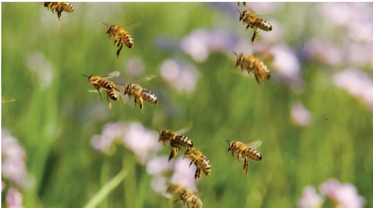
Bier på veg inn i bikuba med pollen og nektar.