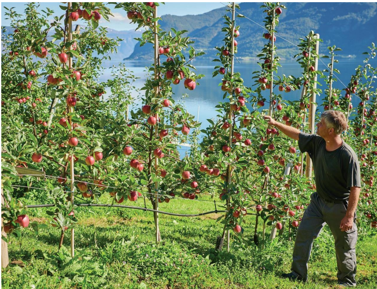
Eit endra klima vil påverke lokal matproduksjon. Her frå ein av mange fruktprodusentar i Vestland, dette frå Leikanger.

Det vert føreslått å etablere ei administrativ og ei politisk referansegruppe for planprosessen. Desse vil undervegs fungere som gode diskusjons- og forankringsgrupper, og ressursar i utarbeiding av planen. Etter vedtak av planen vil desse gruppene kunne vidareførast som samarbeidsorgan for oppfølging av klimaplanen. Planprosessen vil på denne måten også skape gode samarbeidsarenaer for klimaarbeid i regionen og oppfølging av vedtekne mål og tiltak.