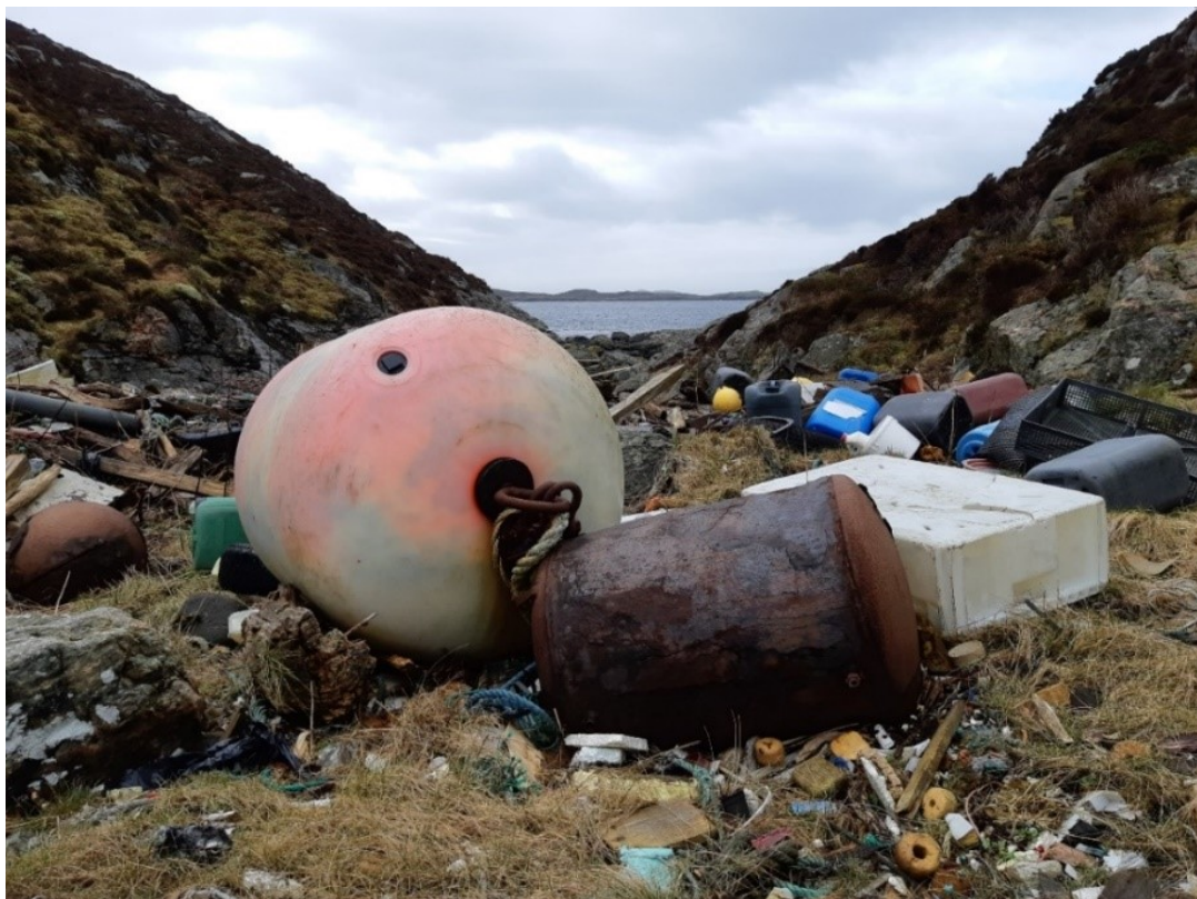
BILDET VISER EIGARLAUST MARINT AVFALL PÅ NESSULLØYNA I ØYGARDEN 2019.

Bergen og omland friluftsråd - BOF utvikla den tidlegare kalla Hordalandsmodellen, nå BOF modellen som har vorte nasjonalt leiande. Det er på bakgrunn av denne samhandlingsmodellen at Vestlandsrådet bestående av dei fire fylkeskommunane; Rogaland, Hordaland, Sogn og Fjordane og Møre og Romsdal i 2018 tilsette eigen prosjektleiar for å jobba med marin forsøpling for økt fokus og sam- koordinering innanfor strandrydding, botnrydding og førebygging av marin forsøpling.