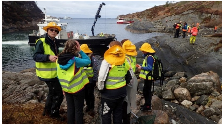
BILDET VISER RYDDIG PÅ SOTRA I 2019.

Oppfølgingsarrangementet eitt år etter den 25-26. april 2018, «Arven etter plasthvalen/ The Plastic Whale Heritage», samla 200 personar frå 14 ulike nasjonar som både rydda plast og deltok på ein stor konferanse på Sotra. Ein konferanse ein kunne gjennomføre med midlar via BOF, og tilskottstildelinga frå HFK. Ein ny Plastic Whale Heritage konferanse er planlagt å gjennomføre i 2020, med blant anna tilskotsmidlar i frå tidlegare Hordaland fylkeskommune.