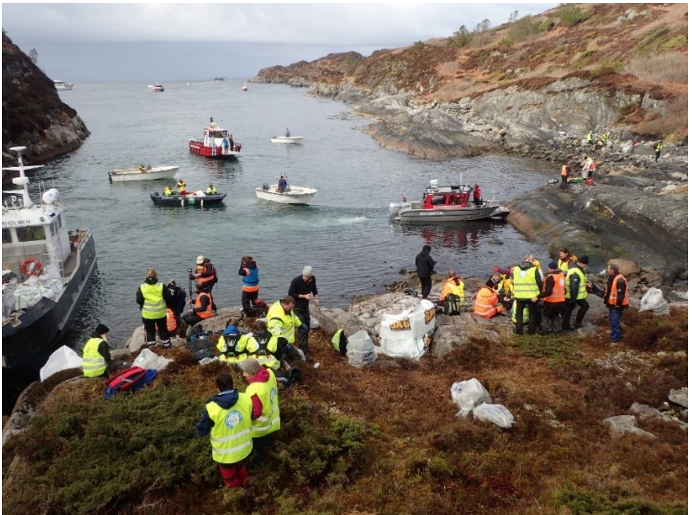
BILDET VISER RYDDING PÅ SOTRA APRIL 2018.

Ein plastfri natur og eit plastfritt hav i Vestland.