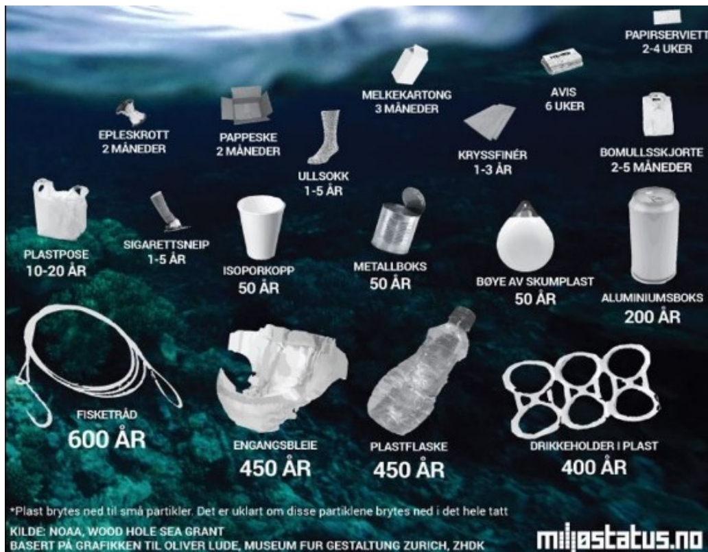
FIGUR OVENFOR VISER ULIKE EKSEMPEL PÅ NEDBRYTNINGSTID AV PLAST OG ANDRE OBJEKT.

Me må erkjenne den globale miljøutfordringa med plastavfall og følge opp internasjonale og nasjonale mål og retningslinjer.