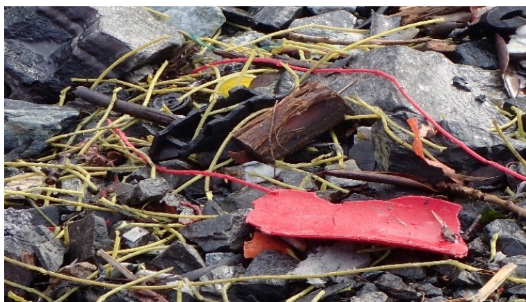
BILDET VISER SKYTSTRENG MED PLAST I NATUREN.