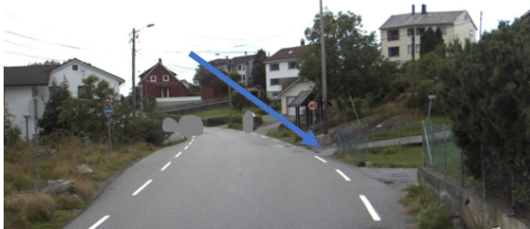
Figur 5 Avkjørsle det er søkt om utvida bruk av er markert med pil.