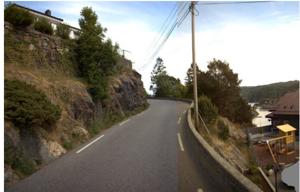
Figur 4 Smal veg og manglande sikt i kurve, retning nordaust om lag 60 meter før Hetlevik barneskule fv. 5246, hp 2, km 5,5215