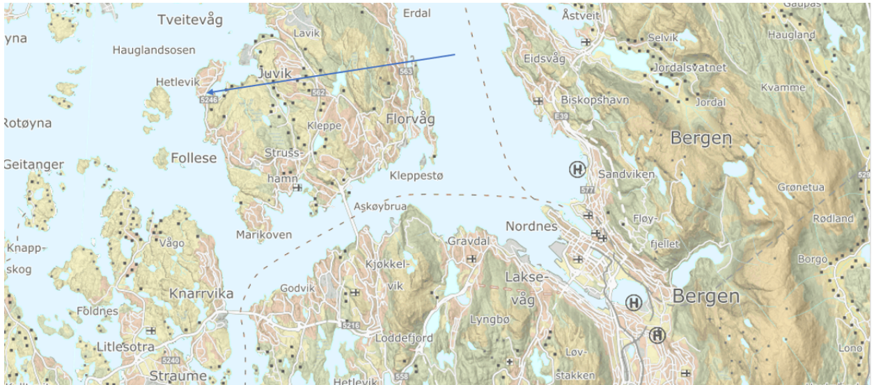
Figur 1 Hetlevik ligg på Askøy, nordvest for Bergen.