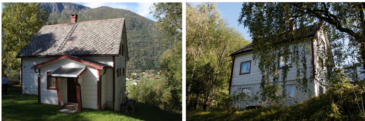
Figur 13. Wittgenstein sitt hus då det stod på Bolstadmoen, før flytting tilbake til opphavleg plass. Foto. A. Bidne/Sogn og Fjordane fylkeskommune 2016.

Innvendig vart og ein del av planløyisinga endra og tilpassa behova til dei som budde i det. Den største endringar var i loftsetasjen som opphavleg bestod av eitt stort rom. No vart den delt opp i fleire soverom og ein liten gang. Huset vart ståande på Bolstadmoen fram til arbeidet med demontering og tilbakeføring til opphavleg stad byrja i 2016.