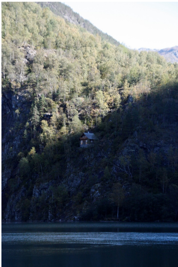
Figur 1. Ludwig Wittgenstein sitt hus ved Eidsvatnet i Skjolden.

Skjolden ligg inst i Lustrafjorden som er ein sidefjord til Sognefjorden. Den vesle tettstaden er omkransa med fjell og på Wittgenstein si tid var det fjorden som var hovudvegen inn til Skjolden. Området i dag er prega av jordbrukslandskap samt ein cruisekai og overnattingsstadar for turistar.