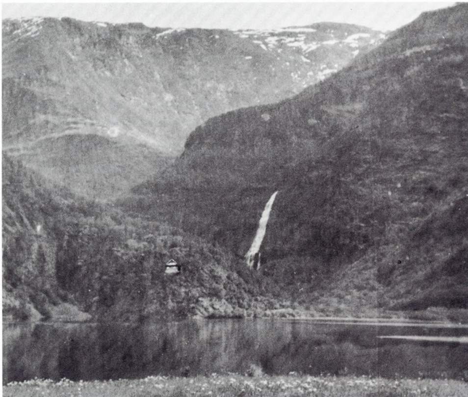
Figur 12. Wittgenstein sitt hus ved Eidsvatnet.