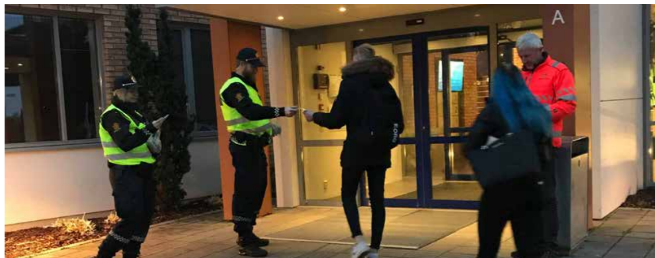
Utdeling av refleks ved Sogndal vidaregåande skule.

Sogn og Fjordane Fotballkrets og Trygg Trafikk inviterte aldersbestemte fotballklubbar til reflekskonkurranse. Her skulle laga kome med gode refleksiltak gjennom å sende inn foto. Vinnarane av konkurransen vart Gaular Idrettslag Jenter 7–8 år, som fekk 4000 kroner til lagkassa.