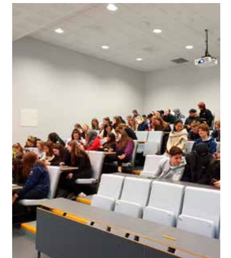
Elevane ved Flora vidaregåande skule i full gang med #ErDuSikker?-kampanjen.