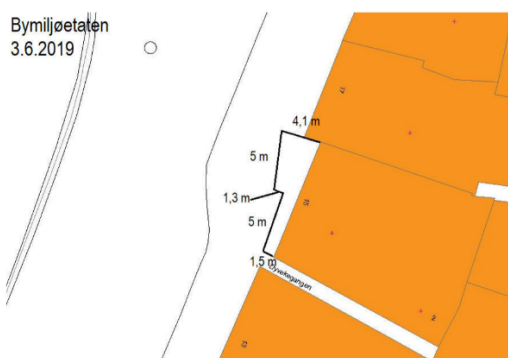
Kartutsnitt over leigeareal i 2019