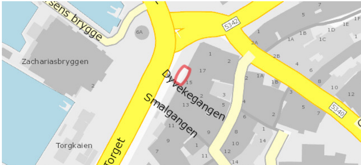
Oversiktskart over kvar ein finn det aktuelle arealet som søkast om å bli leigd

I Torget har Vestland fylkeskommune lagt til grunn at ferdselssona på fortauet skal være 4 m sidan fortauet har svært høg gangtrafikk, og fortausarealet også er venteareal for buss. Dette er grunnleggjande i at arealet skal samsvare med føresegn § 6.3 for kommunedelplan for sentrum som krev minimum 3 m fri fotgjengarbreidde. Vurderingane er gjort i samarbeid med plan- og bygningsetaten som har vurdert saka etter kommunedelplan sentrum, § 6.3.