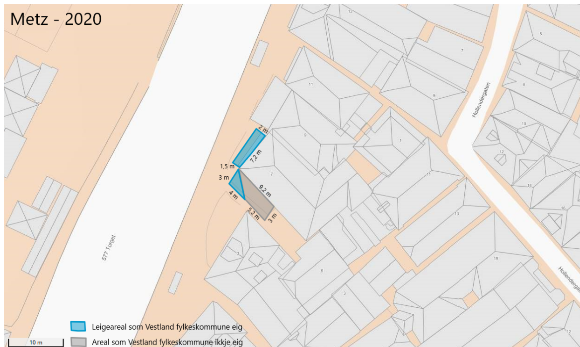
Figuren viser ein illustrasjon av vedtatt leigeareal, og søkt areal som fylkeskommunen ikkje eig. Fylkeskommunalt areal er merka med blått.

I tillegg samtykker Vestland fylkeskommune til leige av areal innover i Søthullet 3 m frå fasaden der arealet er eigd av fylkeskommunen. På grunn av eigedomsgrensa vil dette arealet ha form som ein trekant. Totalt leigeareal frå fylkeskommunen vil vere ca. 18,6 m 2 . Samtykket for dette arealet er eit enkeltvedtak etter veglova §§ 9 og 57. Sjå kartutsnitt under som viser arealet vedtaket gjeld.