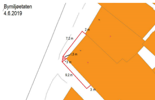
Kartutsnitt over leigeareal i 2019