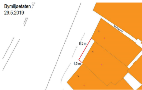
Kartutsnitt over leigearreal i 2019