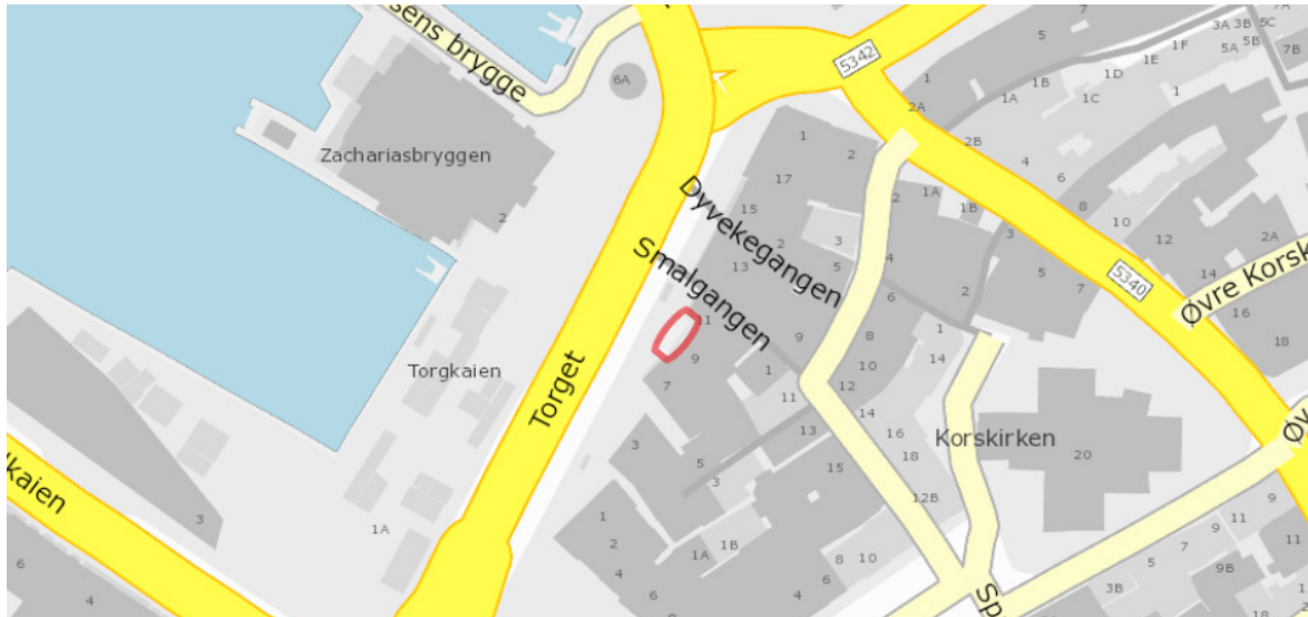
Oversiktskart over kvar ein finn det aktuelle arealet som søkaste om å bli leigd

I Torget har Vestland fylkeskommune lagt til grunn at ferdselssona på fortauet skal være 4 m sidan det er svært høg ferdsel på fortauet. Dette er grunnleggjande i at arealet skal samsvare med føresegn § 6.3 for kommunedelplan for sentrum som krev minimum 3 m fri fotgjengarbreidde. Vurderingane er gjort i samarbeid med plan- og bygningsetaten som har vurdert saka etter kommunedelplan sentrum § 6.3.