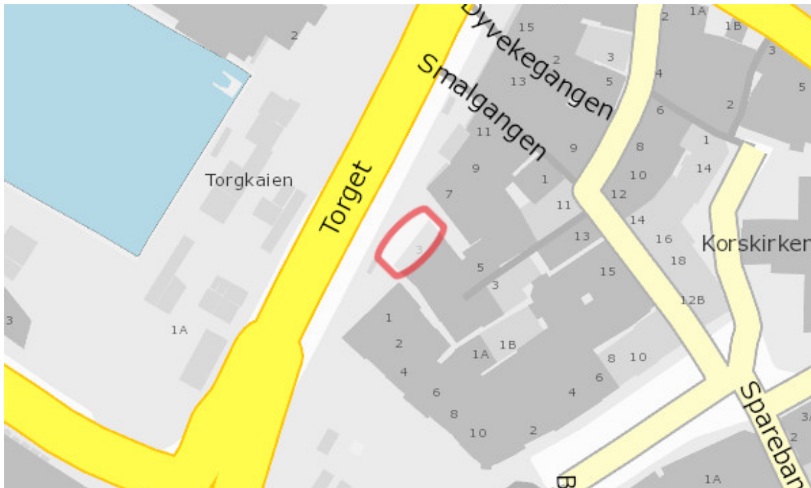
Oversiktskart over kvar ein finn det aktuelle arealet som søkast om å bli leigd

I Torget har Vestland fylkeskommune lagt til grunn at ferdselssona på fortauet skal være 4 m sidan det er svært høg ferdsel på fortauet. Dette er også grunnlagt i at arealet skal samsvare med føresegn § 6.3 for kommunedelplan for sentrum som krev minimum 3 m fri fotgjengarbreidde. Vurderingane er gjort i samarbeid med plan- og bygningsetaten som har vurdert saka etter kommunedelplan sentrum, § 6.3.