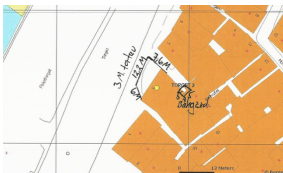
Kartutsnitt som var vedlagt søknaden om leige av areal langs offentlig veg

I 2019 var leigearealet, i ei form som ein trekant, 12 m langs fasaden og 5,5 m frå fasaden på hjørnet ved Søthullet. Dette gav eit leigeareal på ca. 33 m 2 .