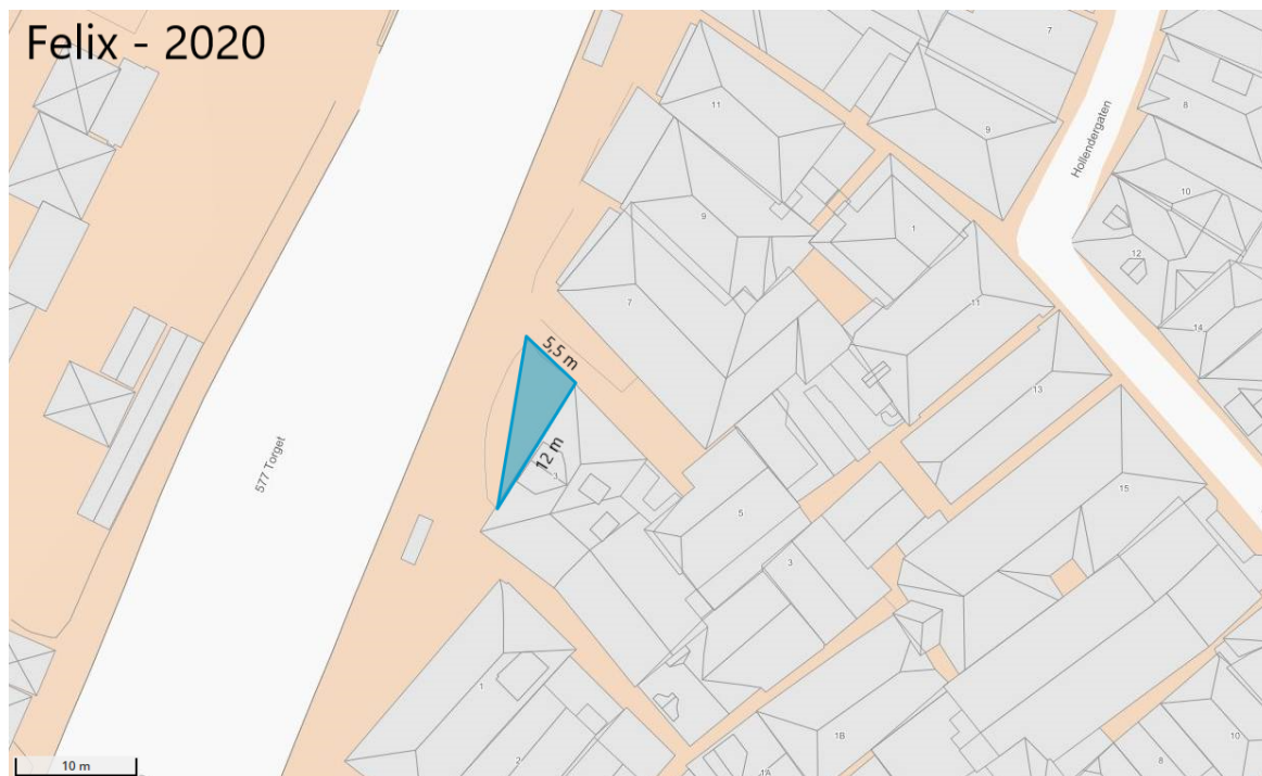
Figuren viser ein illustrasjon av vedtatt leigeareal

Vestland fylkeskommune samtykker for heile 2020 til utleige av fortausareal ved fv.577 Torget i 12 meters lengde og 5,5 meter ut frå fasaden med ei form som ein trekant langs Torget 3. Dette gir eit leigeareal på ca. 33 m 2 . Samtykket for dette arealet er eit enkeltvedtak etter veglova §§ 9 og 57.