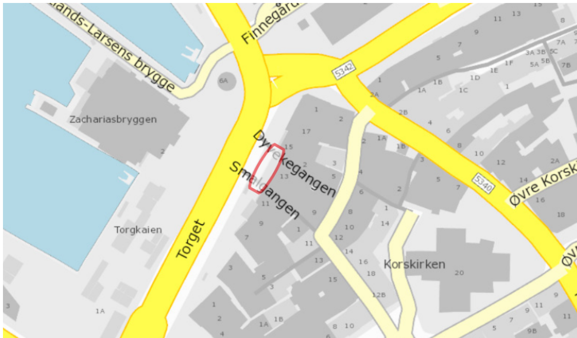
Oversiktskart over kvar ein finn det søkte arealet

Fortausarealet langs fylkesvegen er smalt, og det er svært høg ferdsel på fortauet. I tillegg er det venteareal for buss på fortauet. I Torget har Vestland fylkeskommune lagt til grunn at ferdselssona på fortauet skal være 4 m sidan det er høg ferdsel på fortauet. Dette er grunnleggjande i at det resterande arealet skal samsvare med føresegn § 6.3 for kommunedelplan for sentrum som krev minimum 3 m fri fotgjengarbreidde. Vurderingane er gjort i samarbeid med plan- og bygningsetaten som har vurdert saka etter kommunedelplan sentrum, § 6.3.