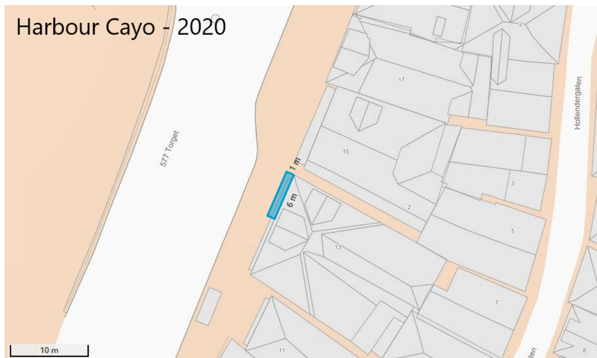
Figuren viser ein illustrasjon av vedtatt leigeareal

Vestland fylkeskommune samtykker for heile 2020 til utleige av fortausareal ved fv. 577 Torget i 6 meters lengde langs fasaden og 1 meter ut frå fasaden langs Torget 13. Dette er det same arealet som i 2019. Totalt areal er 6 m 2 . Samtykket for dette arealet er eit enkeltvedtak etter veglova §§ 9 og 57.