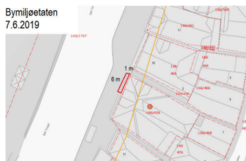
Kartutsnitt over leigeareal utanfor Torget 13 i 2019