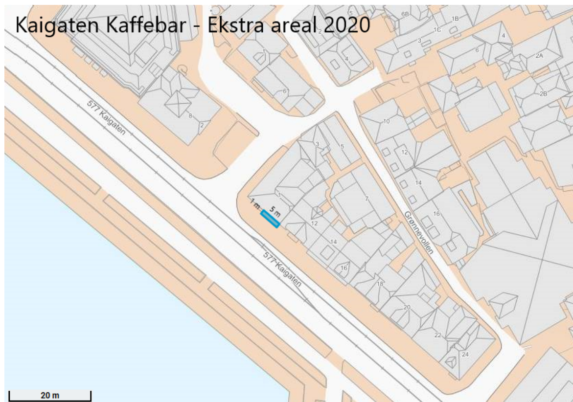
Figuren viser ein illustrasjon av det nye vedtekne leigeararealet

Vestland fylkeskommune samtykker for sesongen 01.04.2020 - 30.09.2020 til utleige av fortausareal i 5 meters lengde og 1 meter ut frå fasaden langs Grønnegaten 1 frå allereie vedtatt areal langs Kaigaten 12. Dette gir eit totalt leigearreal på 5 m 2 langs fasaden til Grønnegaten 1. Samtykket for dette arealet er eit enkeltvedtak etter veglova §§ 9 og 57.