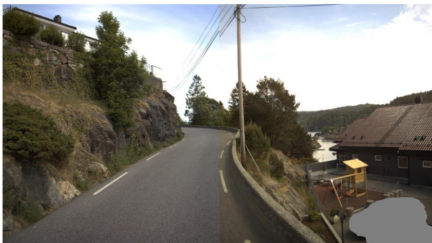
Figur 4 Smal veg og manglande sikt i kurve, retning nordaust om lag 60 meter før Hetlevik barneskule Fv. 5246, hp 2, km 5,5215