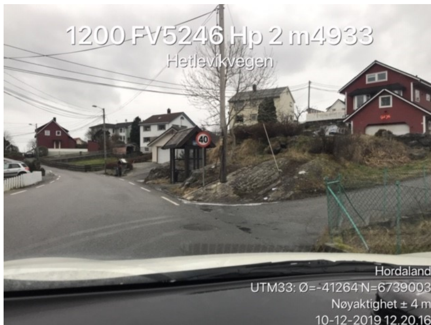
Figur 3 Avkøyrsla det er søkt utvida bruk av og avkøyrslar som skal stengast som følgje av det omsøkte tiltaket.