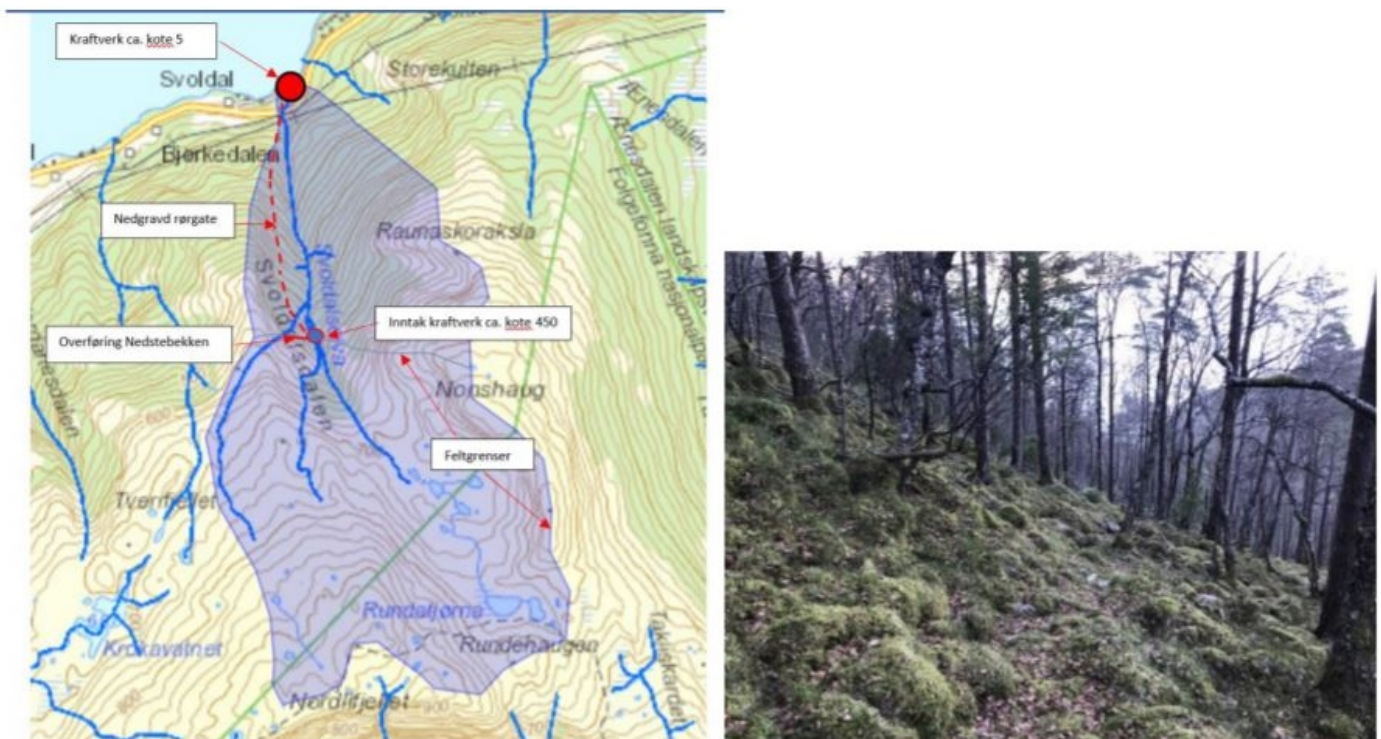
Figur 2. Nedslagsfelt Svoldalselva og typisk område for røytrase og anleggsveg