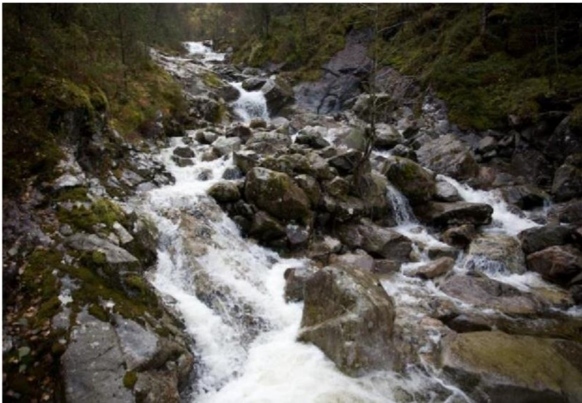
Figur 4. Vassføring stipulert til omlag 250 – 300 liter/sekund sentralt i elva