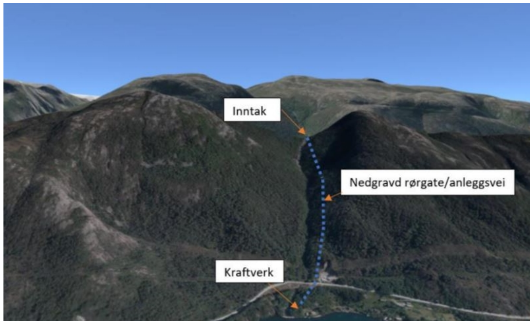
Figur 3. Område med omtrentleg plassering av vassintak, rørgate, kraftverk og midlertidig anleggsveg