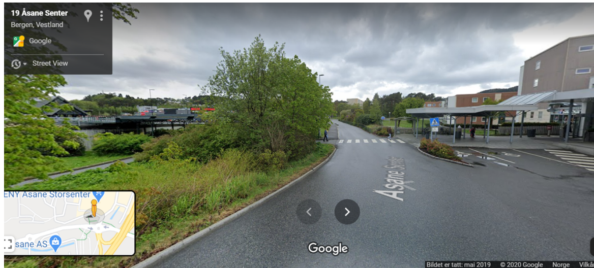
Figur 5 viser Åsane storsenter til høgre i bilete. På venstre side av vegen, der gangfeltet endar, går gangvegen til Åsane bussterminal.

vegetasjonen ved desse punkta, vert sikta tilfredsstillande i alle retningar ved gangfeltet. Punkt 1 i klagar sitt brev vil då vere løyst.