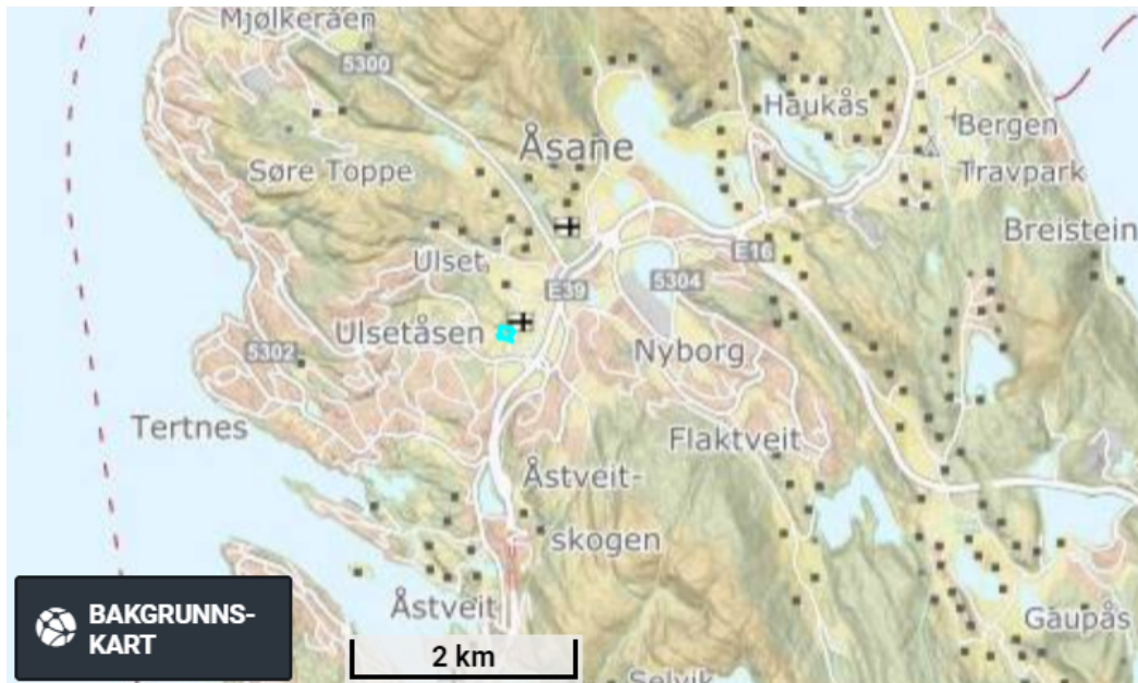
Oversiktskart 1, anleggsområdet er vist med grønt.