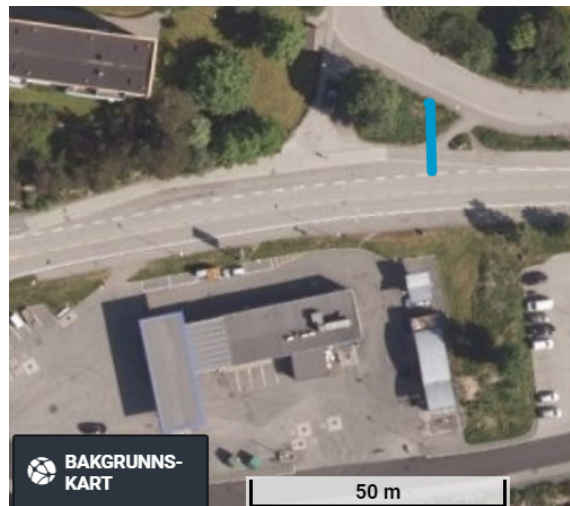
Figur 4. Lengda frå vegkant fv. til kant gangveg er 13,5 meter.

Figur 3. Lengda på lastebil er 11 meter.