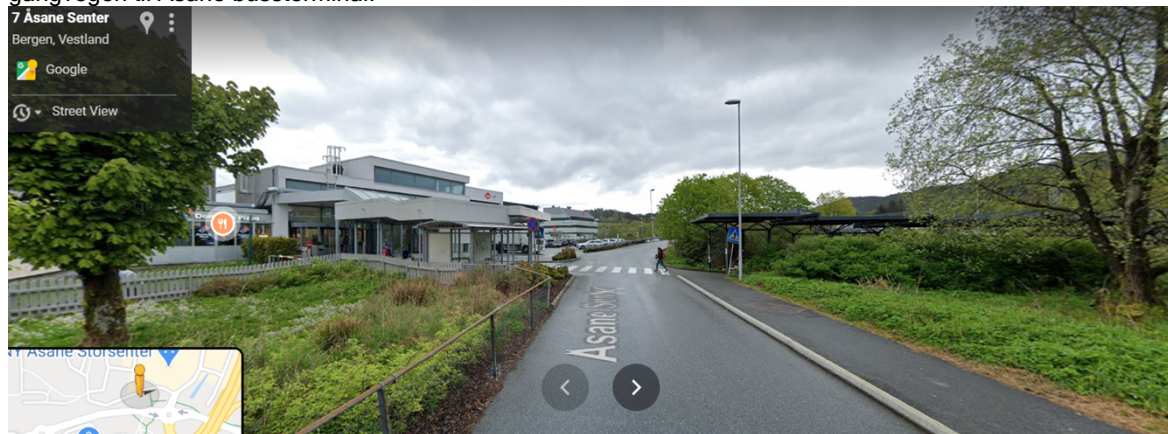
Figur 6 viser same stad som i figur 5, men i motsett køyreretning. Klagar påpeiker dårleg sikt på høgre side av gangfelt, men dersom ein ryddar vegetasjon vil ein oppnå god sikt.

I høve trafikkavvikling kan det vere utfordringar med kødanning til og frå rundkøyringa som er vist i figur 1. Dette problemet vil gjere seg gjeldande primært på morgon og ettermiddag. Dette problemet kan løysast ved å utarbeida ein arbeidsvarslingsplan der ein regulerer trafikken.