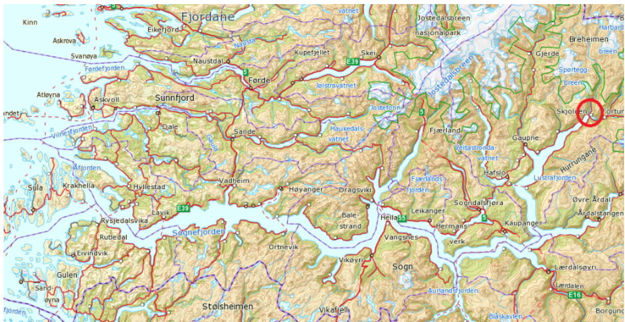
Figur 3. Oversiktskart over Sognefjorden. Skjolden er merka av med raud runding.