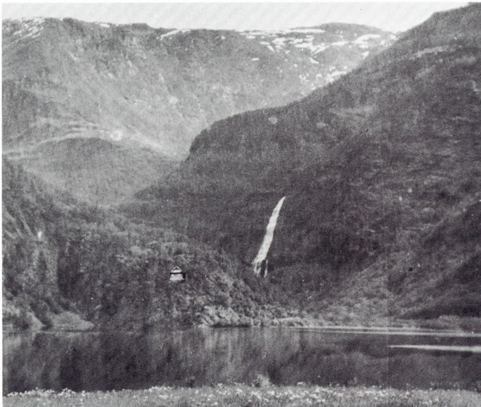
Figur 12. Wittgenstein sitt hus ved Eidsvatnet. Datering ukjend