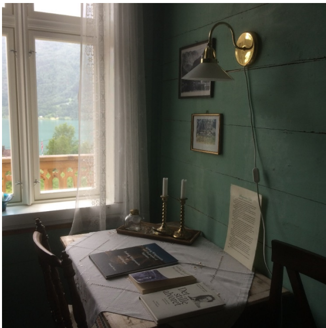
Figur 11. Wittgenstein sitt rom på hotellet på Eide gard.