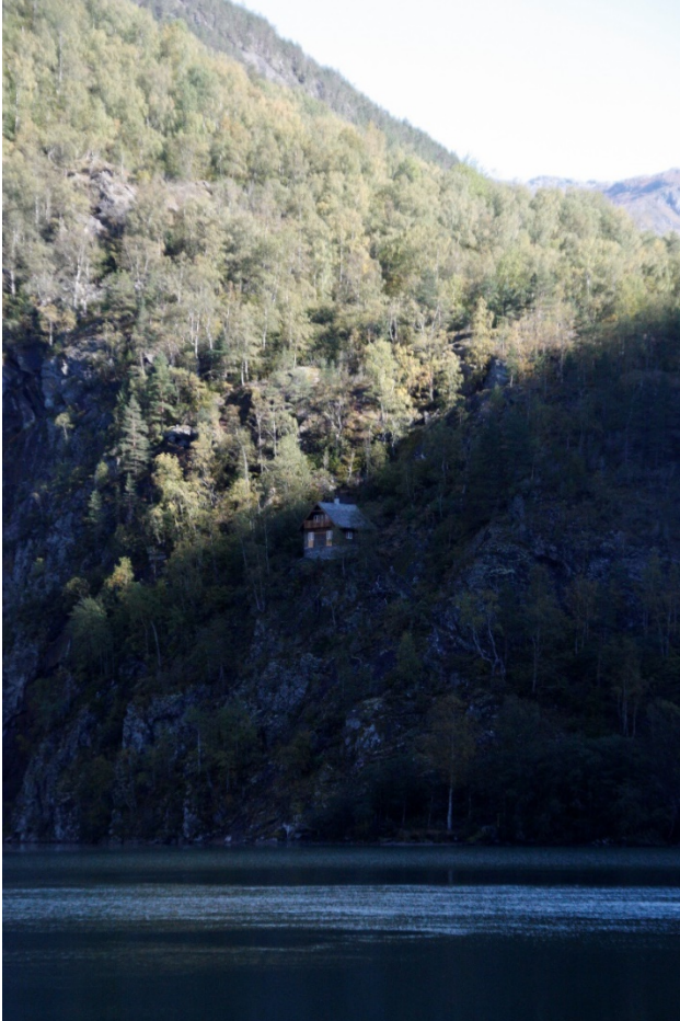
Figur 1. Ludwig Wittgenstein sitt hus ved Eidsvatnet i Skjolden.

Skjolden ligg inst i Lustrafjorden som er ein sidefjord til Sognefjorden. Den vesle tettstaden er omkransa med fjell og på Wittgenstein si tid var det fjorden som var hovudvegen inn til Skjolden. Området i dag er prega av jordbrukslandskap samt ein cruisekai og overnattingsstadar for turistar.