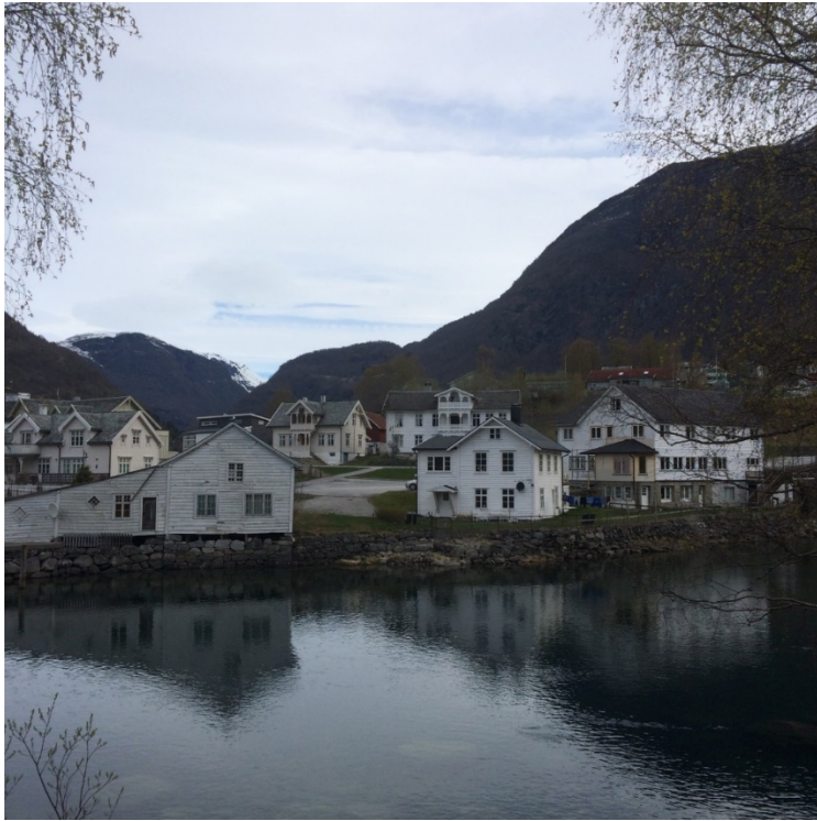
Figur 2. Skjolden 2018. Klingenberghuset er sentralt i bildet bak Drægni si handelsbu (nede til venstre) Ved sida av Klingebberghuset står Storehuset til H. Drægni. På sitt første besøk i Skjolden i 1913 leigde Wittgenstein rom i Klingenberghuset.