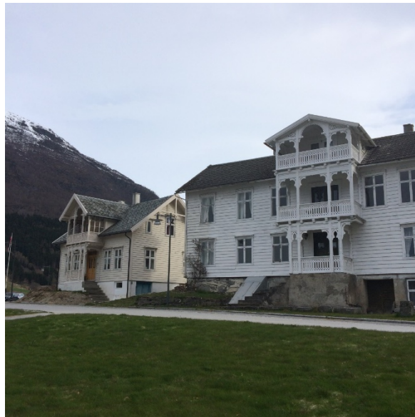
Figur 9 og 9. Klingeberghuset til venstre. Biletet til høgre syner både Klingeberghuset og Storehuset.