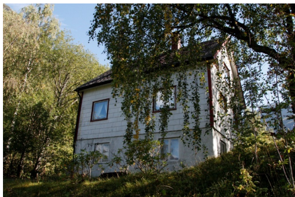
Figur 13. Wittgenstein sitt hus då det stod på Bolstadmoen, før flytting tilbake til opphavleg plass.