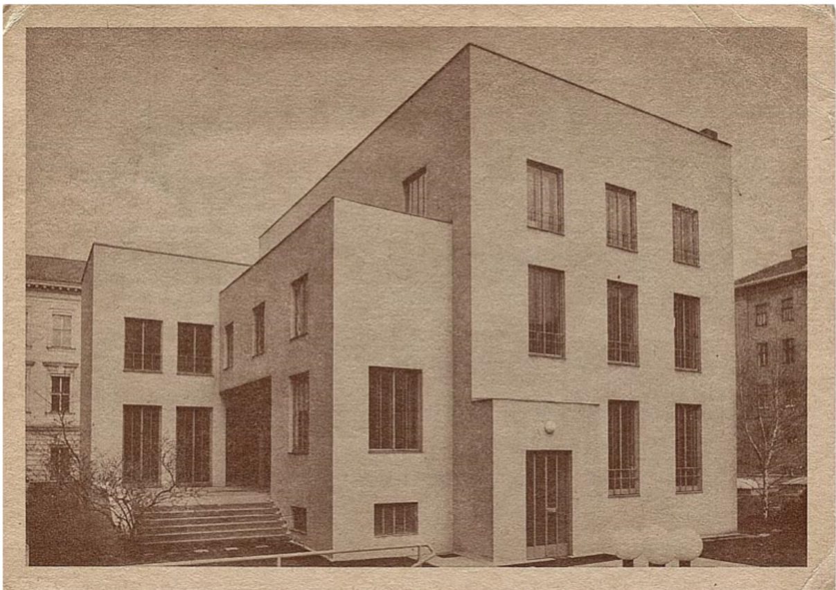
Figur 8. Haus Wittgenstein i Wien.