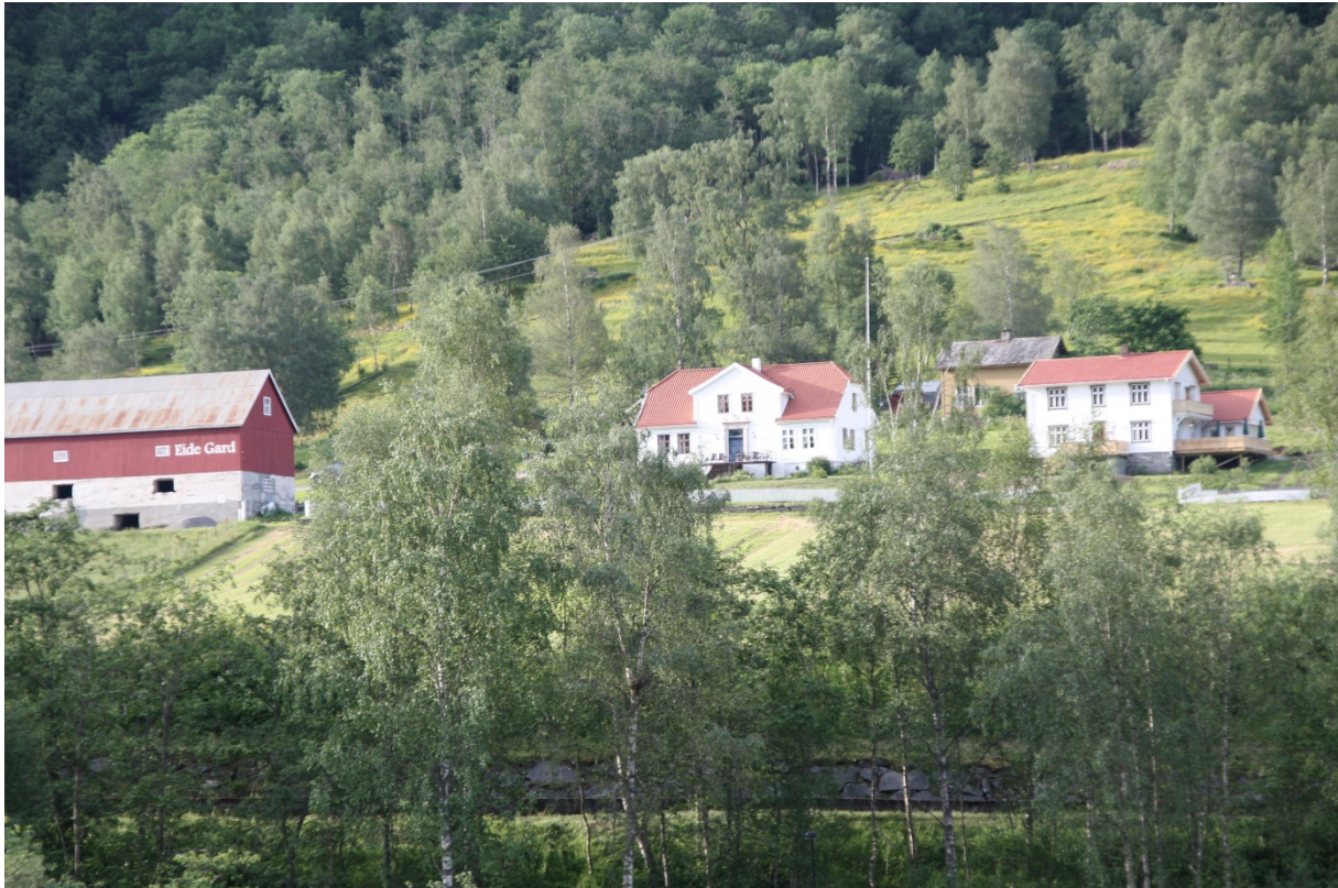
Figur 10. Eide gard, hotellet er bygningen lengst til høyre. Wittgenstein budde her i periodar då det vart for vanskeleg for han å bu i huset sitt ved Eidsvatnet..