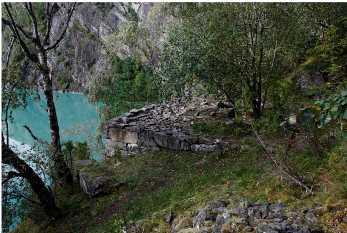
Figur 14. Grunnmuren til huset slik den stod i 2016, før huset vart ført tilbake til opphavleg stad.

Då huset vart sett opp på Bolstad nytta ein opp att nesten all material. Vindauga var skifta, men dei opphavlege vindauga var tatt vare på av Harald Vatne. Ved at så mykje av den opphavlege materialen var tatt vare på vart det mogleg å flytte huset tilbake på opphavleg plass og få tilbake den utforminga det hadde hatt då Wittgenstein bygde det. I arbeidet med å føre opp att huset har stiftinga lagt vekt på å vise kva material som er ny og kva som er den opphavlege. Det gjer at vi i huset slik det står i dag lett kan lese bygningshistorikken knytt til flyttinga og tilbakeflyttinga av huset.