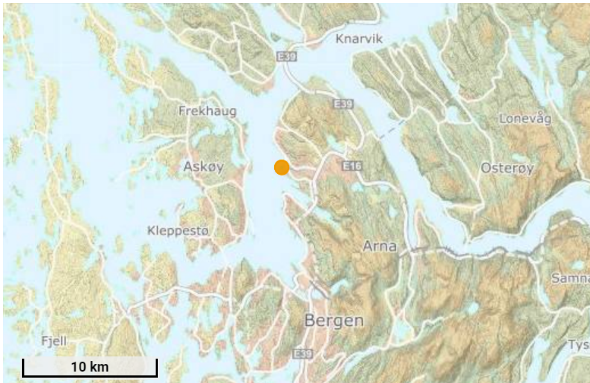
Oversiktskart 1, gnr. 186 bnr. 157 er vist i oransje.