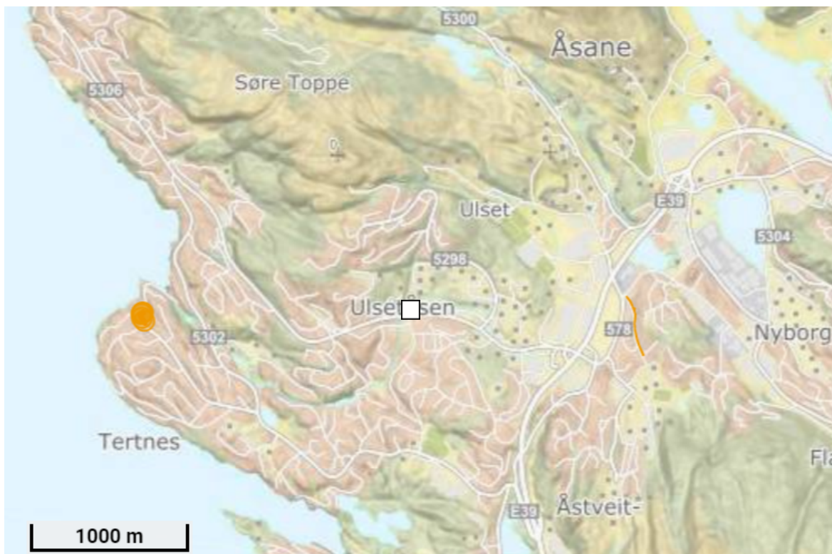
Oversiktskart 2, gnr. 186 bnr. 157 er vist i oransje.