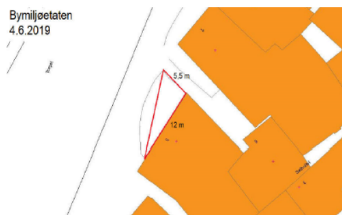
Kartutsnitt over leigeeareal i 2019