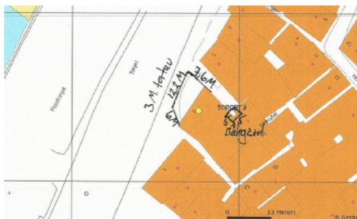
Kartutsnitt som var vedlagt søknaden om leige av areal langs offentlig veg