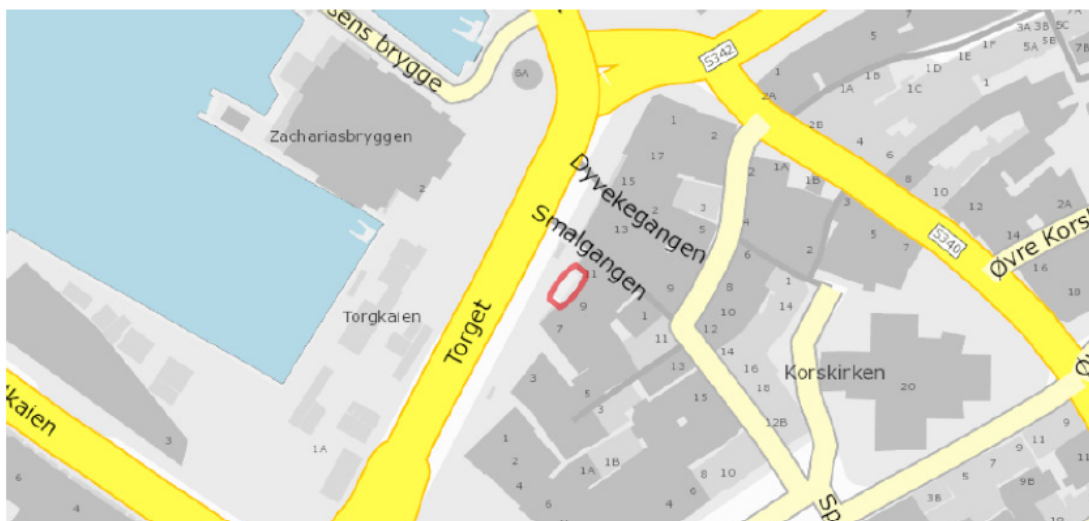
Oversiktskart over kvar ein finn det aktuelle arealet som søkast om å bli leigd