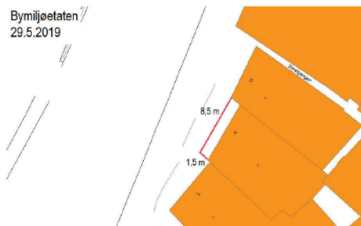
Kartutsnitt over leigeareal i 2019