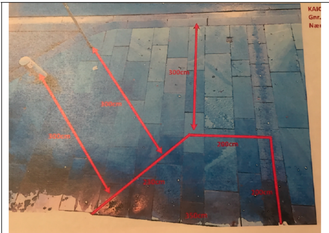
Bildet viser omsøkt avstand 3,5 m langs husvegg, 2 m ut på fortau, 2 m til knekkpunkt og ei skrå linje på 2,3 m ned til fasade.