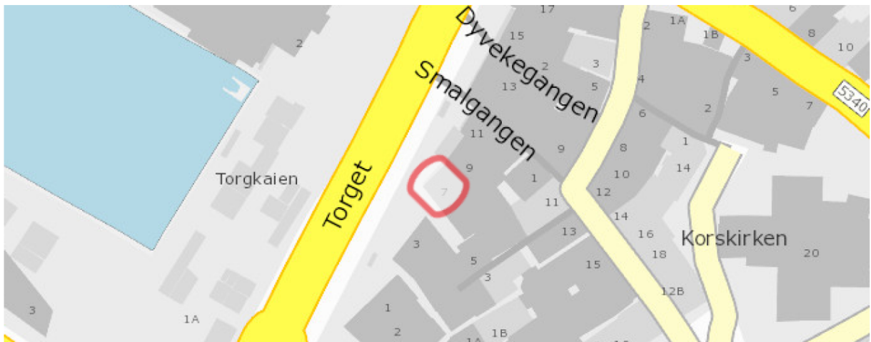
Oversiktskart over kvar ein finn det aktuelle arealet som søkast om å bli leigd