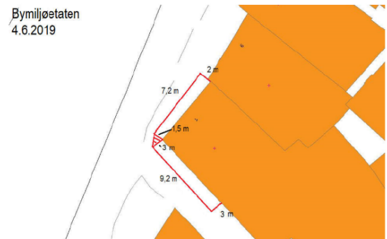
Kartutsnitt over leigeareal i 2019