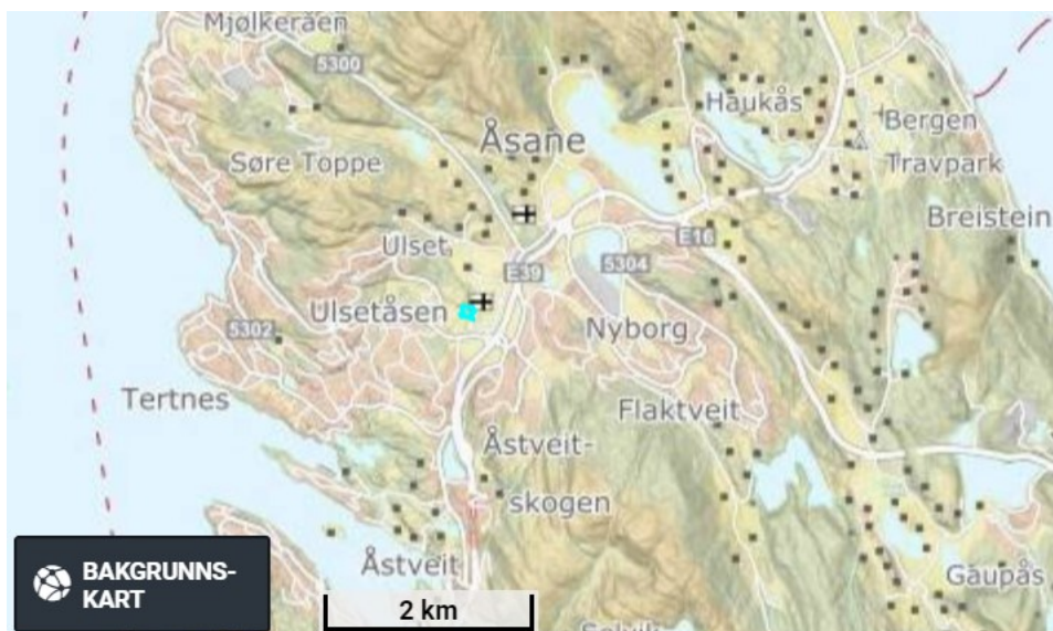
Oversiktskart 1. Anleggsområdet er vist med grønt.