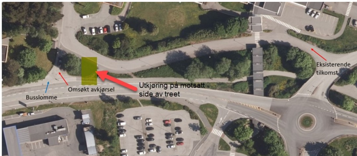
Bilde 1, innsendt av Skanska Norge As den 13.03.2020.