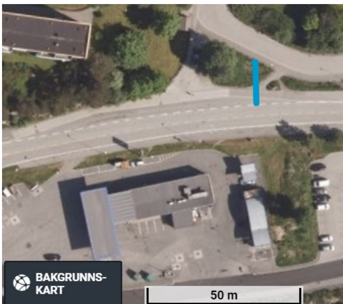
Bilde 2. Lengda frå vegkant fv 5306 til kant gangveg er 13,5 meter.