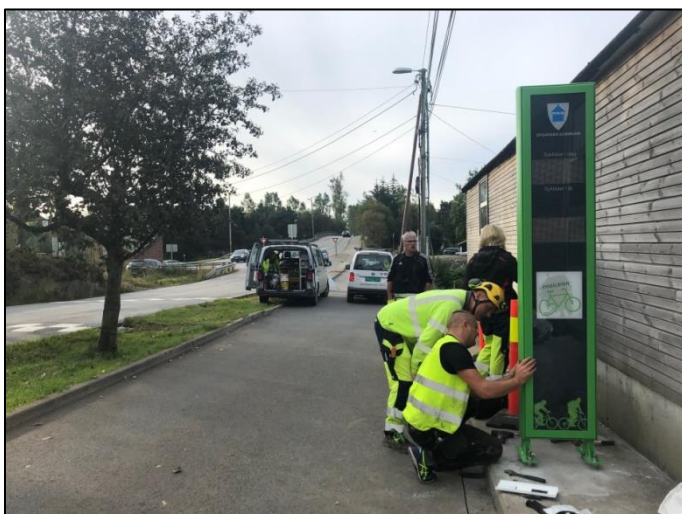
Figur 3: oppsetjing av sykkelteljar