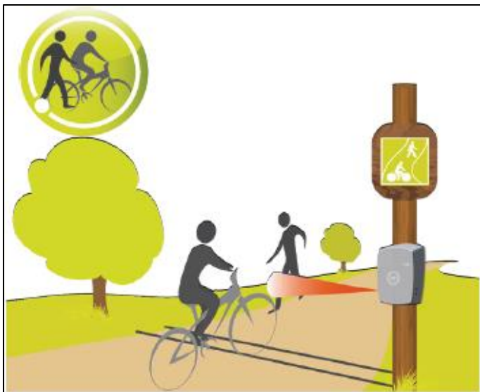
Figur 2: korleis mobil sykkelteljar fungerer, figur lånt av Eco-counter brukarmanual for mobil sykkelteljar