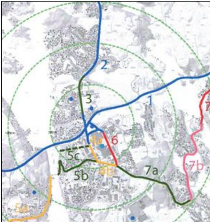
Figur 8: Sykkeltiltak i regionsenteret Straume

I 2018 vart vi tildelt midlar/tilskot frå Statens vegvesen (i samråd med Hordaland fylkeskommune) til tiltak som å aukar sykkkelbruken. Midlane vart øyremerka sykkeltiltak for delstrekningane 4a og 4b i fig. 8. Desse midlane vart overført til 2019. Vi har dette året jobba saman med Statens vegvesen for å få etablert sykkeltiltaka samstundes som det vert utført førebuaende arbeid på Sotrasambandet i Arefjordvegen og Sartorvegen. Samtidig ser vi også på moglegheita for å få på plass sykkeltiltak på delstrekninga 7a i fig. 8. Dette er eit arbeid som vert følgd vidare opp i 2020.