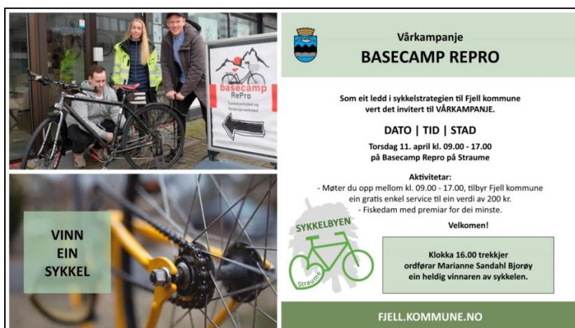
Figur 5: profileringsplakat i forkant av vårkampanje

Vi reklamerte i forkant av vårkampanjen i lokalavisa, samt informerte rundt på Sartor storsenter, og på Fjell kommune sin heimeside og facebook-side (Figur 5). Dette ble ein vellykka dag, som vi planleggjar å vidareføre de komande årane.