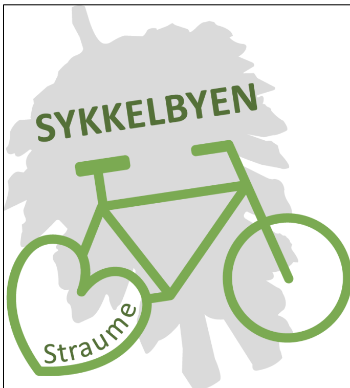
Figur 6: logo for sykkelbyen Straume

https://www.fjell.kommune.no/plan-bygg-og-eigedom/sykelbyen-straume/