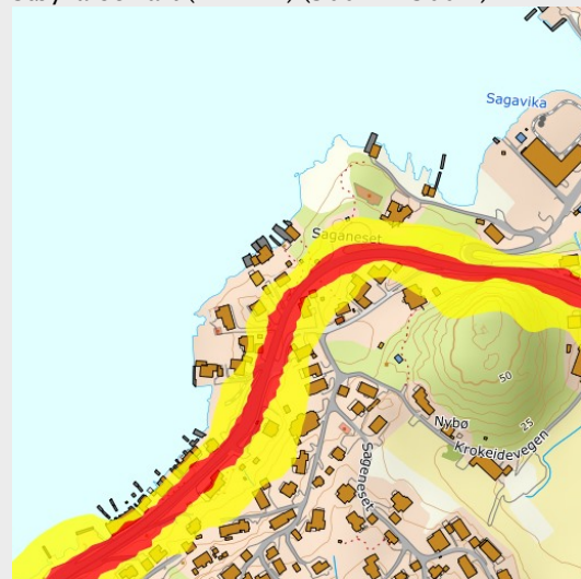
Støyvarselkart (T-1442) (500m x 500m)