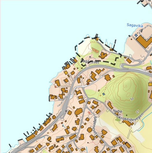
Reguleringsplaner (500m x 500m)