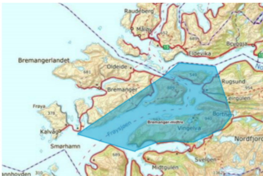
Illustrasjonen syner KULA-området for midtre Bremanger: Skatestraumen, Rugsund og Vingen.

Vestland fylkeskommune er no i gang med å utarbeide forslag til kulturhistoriske landskap av særskilt nasjonal interesse (KULA-område) for Riksantikvaren. Eitt av desse KULA-områda omfattar midtre Bremanger som tar med seg eit større landskapsområde kring Vingen: Skatestraumen, Rugsund og Vingen. Hornelen, Nord-Europas høgste sjøklippe ligg i dette landskapet og er godt synleg frå Vingen.