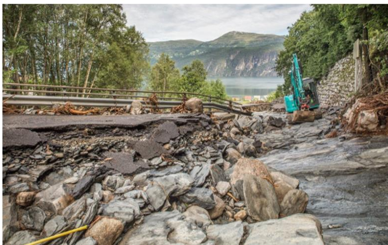
Skadane på fv. 60 er omfattande.