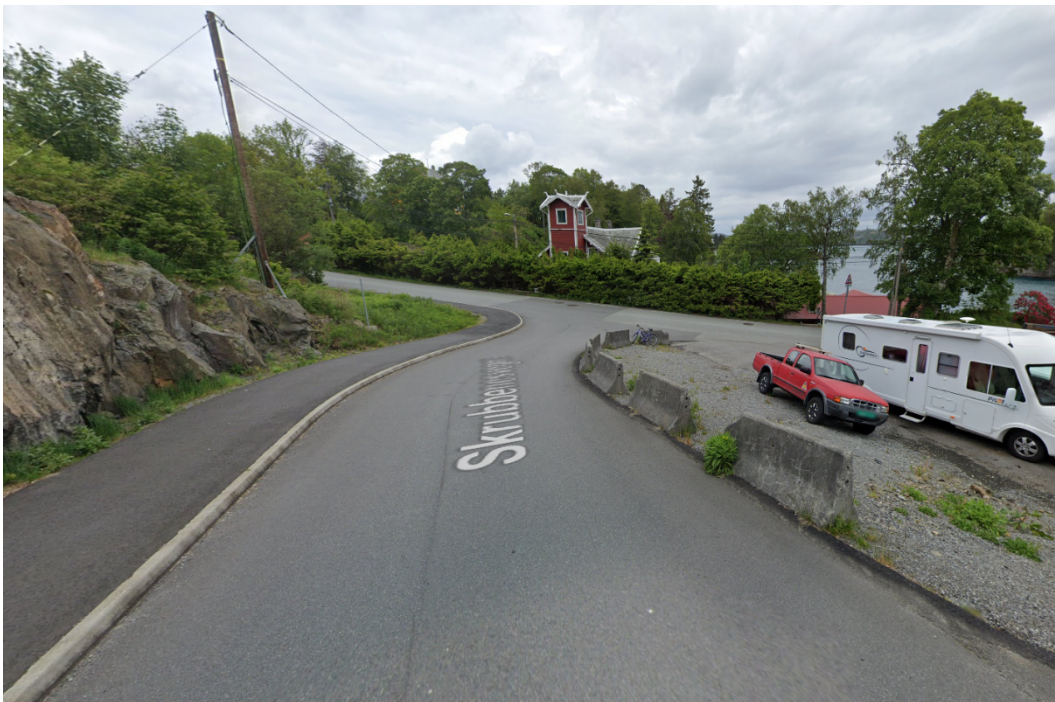
Bileta er frå google streetview (juni 2019)

Avkøyrsla er ikkje tilfredsstillande opparbeida etter reguleringsplanen. Det er plassert sperrestein i krysset kor det er merka som fortau i reguleringsplanen. Dette meiner vi er eit faremoment ved påkøyring og er ei løysing Statens vegvesen tidlegare ikkje har akseptert, og som vi heller ikkje vil akseptere. Det manglande fortauet må på plass her for å kunne ivareta mjuke trafikantar.