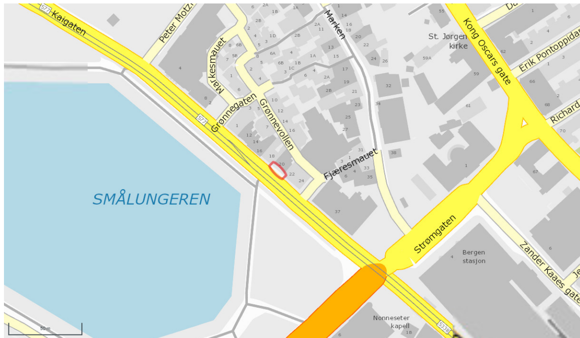
Oversiktskart over kvar ein finn det aktuelle arealet som er søkt om å bli leigd

«Serveringsareal på fortau skal ikke være bredere enn at det skal være minimum 3 meter fri og sammenhengende gangpassasje. På fortau med stor/overordnet ferdsel av fotgjengere og/eller syklist, kan kravet til fri gangpassasje overgå 3 meter. Uttalelser fra vegmyndighetene vil bli tillagt stor vekt i den enkelte sak. Uteservering skal ikke vanskeliggjøre fremkommeligheten til syns- og bevegelsehemmede.»