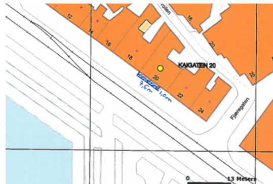
Kartutsnitt over areal for uteservering for adressa i 2019