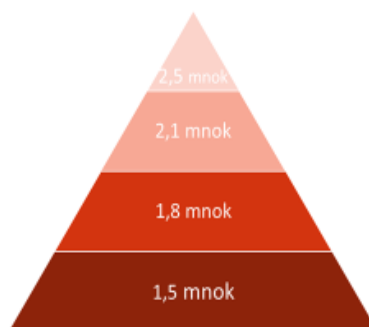
Næringshageprogrammet ramme 1