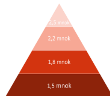
Næringshageprogrammet ramme 2