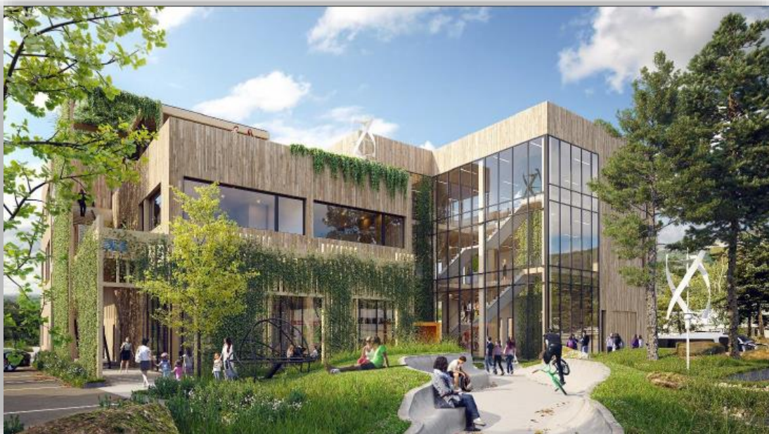
Bilde: Sogndal VGS og ViteMeir. Byggherre Vestland fylkeskommune. Entreprenør Åsen & Øvrelid AS.

Bygginga er no i gang, Vestland fylkeskommunen er byggherre. Opning er noko utsett, til seint hausten 2021.