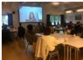
Oktober, digitalt: velferds-teknologiens ABC