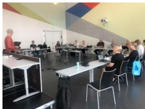
Førde, 21. august: oppstarsamling E-helse Vestland