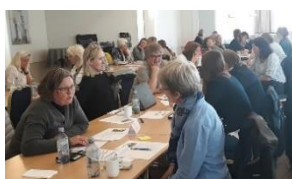
Bergen, august: kurs i endringsleiing