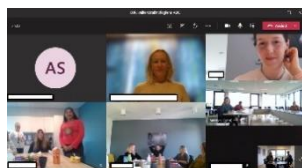
Oktober, digitalt: velferds-teknologiens ABC