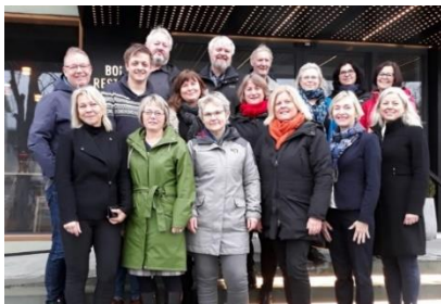
Gruppa som var med å etablere E-helse Vestland i januar 2020

Det er etablert styrings- og prosjektgruppe. Første møte i prosjektgruppa var 21. oktober og styringsgruppa 18. desember.