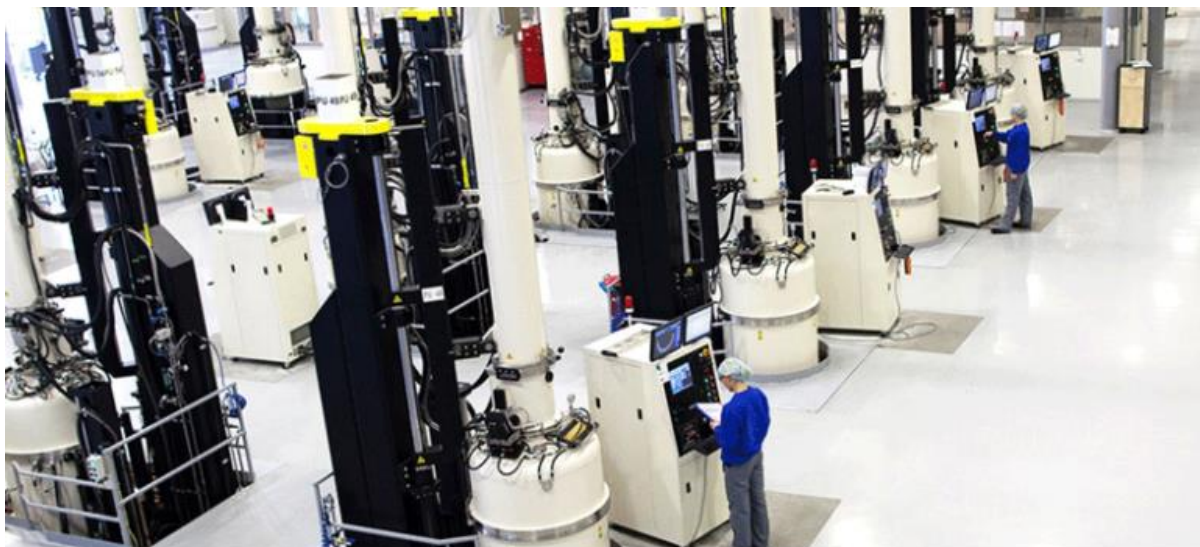
Norsun AS, Produksjon av solceller i Årdal

Frå Verdiskapingsprogrammet for fornybar energi i landbruket er det løyvd støtte til eit forprosjekt for varmesalsanlegg, og ein forstudie for etablering av biogassanlegg på gardsnivå. Det er ytt støtte til mobiliseringsaktivitetar innanfor bioenergi. Prosjektet er ei samfinansiering mellom fylkeskommunen og Innovasjon Norge, der det er sett av midlar til informasjonsmøte og oppfølging av inntil 12 gardsbruk med gjennomføring av forstudie.