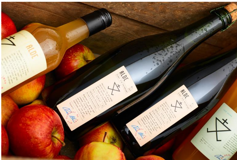
Sider frå Hardanger - Alde

For ytterlegare informasjon syner vi til landbruksdelen i årsmeldinga nedanfor.