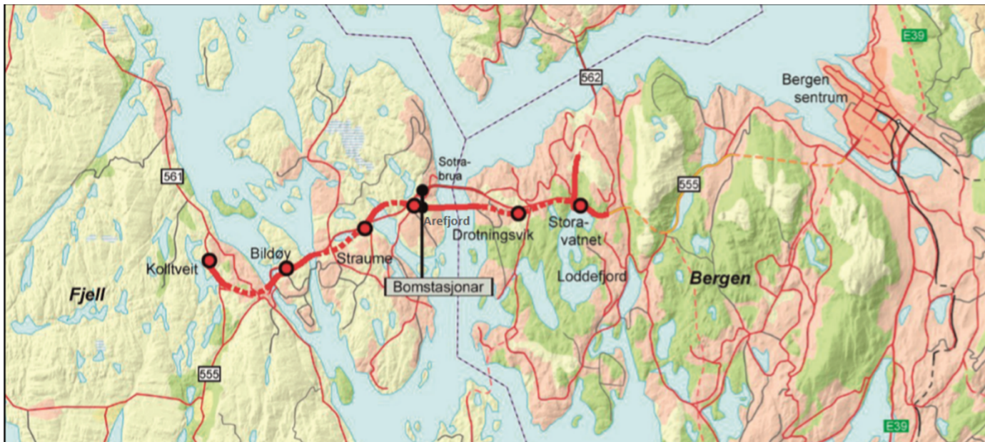
Figur 1 Kart over Rv. 555 Sotrasambandet. Raud tjukk linje marker nytt Sotrasamband med tunnelar (stripla linje) og veg i dagen (heil strek). Dei raude prikkane er kryss til dagens veg. Dei svarte prikkane markerer bomstasjonane ved ny og gammal Sotrabru.

Tilhøva på dagens Sotrabru er venta å verte vesentleg betre når nytt samband opnar for trafikk med det vedteke bompenggeopplegget. Trafikkberekningane syner at trafikken vil gå ned frå dagens nivå på 27 600 til under 3 000 på den gamle Sotrabrua. Eit slikt trafikknivå er meir tilpassa standarden på brua. I tillegg må det gjerast vesentlege oppgraderingar og rehabiliteringar av den gamle Sotrabrua, når nytt samband er bygd. Dette må gjerast for at lokal- og kollektivtrafikken skal kunne nytte denne i framtida, slik at også dei som nyttar gamal Sotrabru kan seiast å ha nytte av utbetringane. Lokaltrafikken på strekninga mellom Arefjord og Drotningstvik vil også få nytte av vegprosjektet Rv. 555 Sotrasambandet, når trafikantane skal vidare på det nye vegen frå Drotningstvik mot Stora-vatnet eller frå Arefjord mot Straume og Kolltveit.