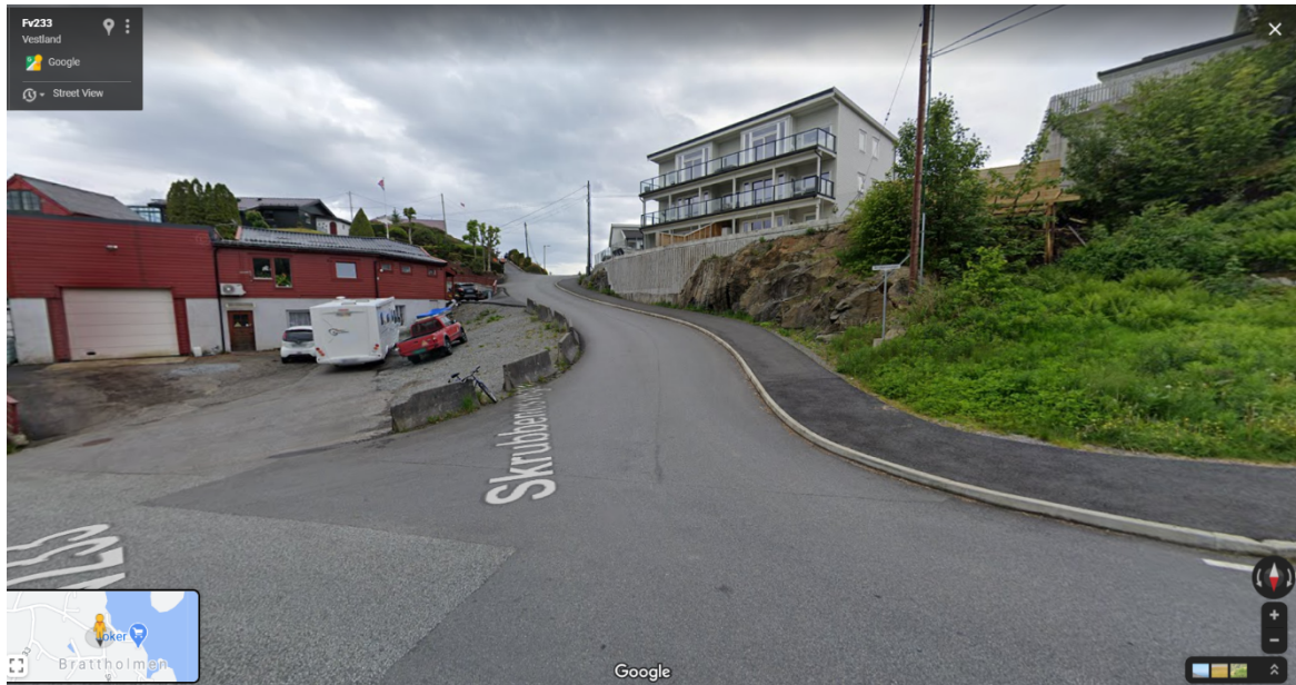
Figur 3: Avkøyrse sett frå fv. 5286.

Den aktuelle avkøyrsele er tilkomst til over 10 bustadeiningar, og er delvis utforma som eit kryss. Begrepet avkøyrsele vert normalt nytta om all tilkomst mellom offentleg veg og tilknytta eigedommar jf. Arnulf/Gauer, Veglova med kommentarar 1997: « Begrepet må sies å omfatte den fysiske tilkobling mellom offentlig veg og privat eiendom som er nødvendig for å skaffe gangadkomst eller kjørbær adkomst til tilliggende privat eiendom. » Skrubbenesvegen er ikkje drifta eller halden ved like av det offentlege, og er difor ikkje definert som offentleg veg jf. veglova § 1. Me legg difor til grunn at tilkomsten til fv. 5286 er ein avkøyrsele.