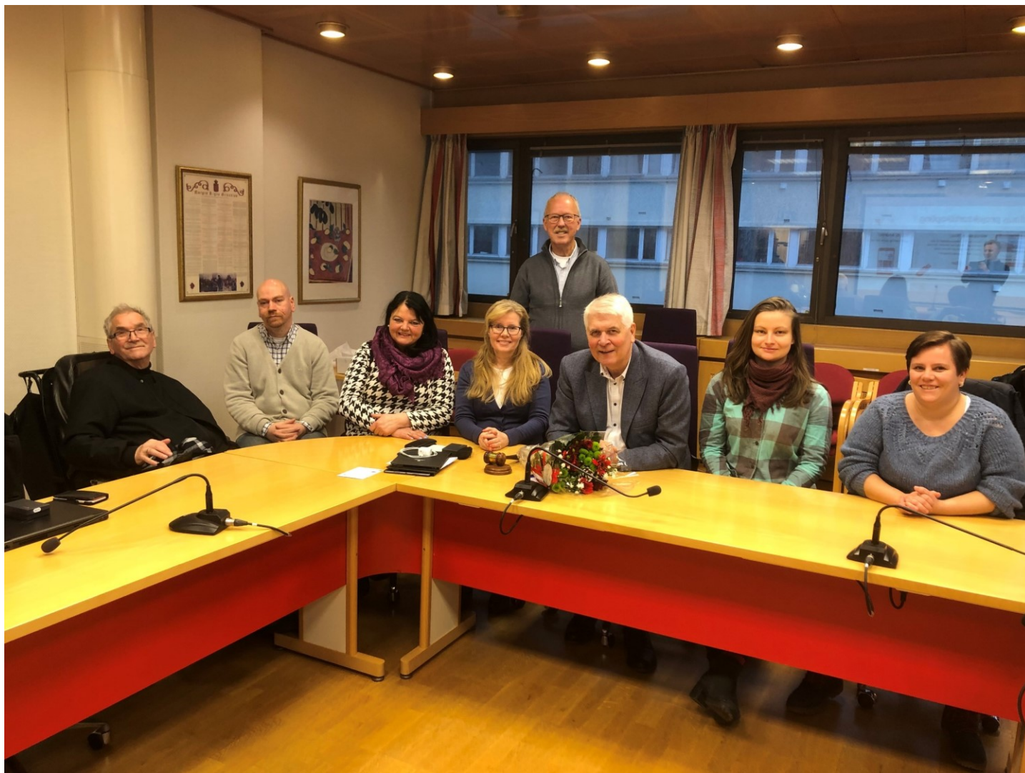
Rådsmedlemmane i RMNF Hordaland, med møtesekretær.