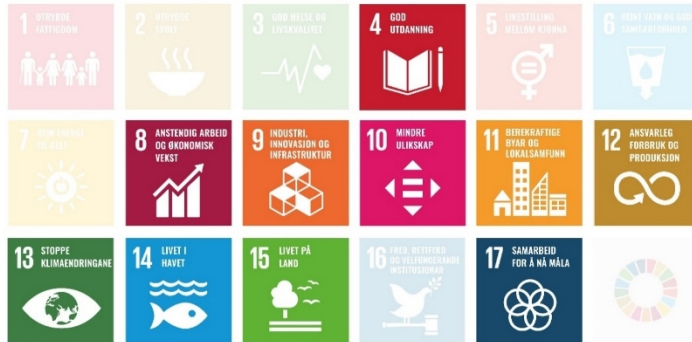
Figur 1: FN sine berekraftsmål med prioriterte mål for Vestland i denne planperioden 4, 8, 9, 10, 11, 12, 13, 14 og 15.

Utviklingsplanen løftar FN sine berekraftsmål som hovudsporet for samfunnsutviklinga i Vestland, og er spegla i visjonen «berekraftig og nyskapande». Dette inneber at vi på lang sikt skal vi ivareta ei positiv utvikling innanfor alle desse måla. Utviklingsplanen peiker på kva som er Vestland sine største utfordringar no, og prioriterer innsatsen på kort sikt. For å nå berekraftmåla må vi jobbe på tvers av fag og sektorar, og mellom forvaltningsnivå. Fylkeskommunen har ei viktig rolle i denne samordninga.