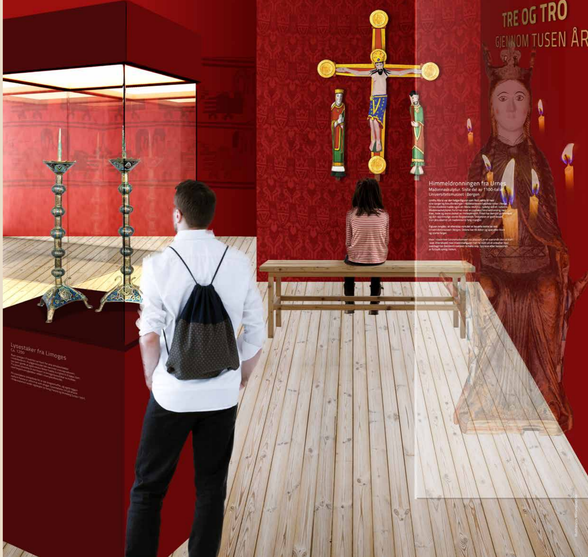
Lysetaker fra Limoges Ca. 1200 På Urnes stavkirke er det bevart et av de mest imponerende lysetakerne som finnes i Norge. Lysetakeret er laget av messing og er utformet som en stilisert blomst. Det er et utmerket eksempel på den høye kvaliteten på de metallarbeidene som ble utført i Urnes i slutten av 1100-tallet.