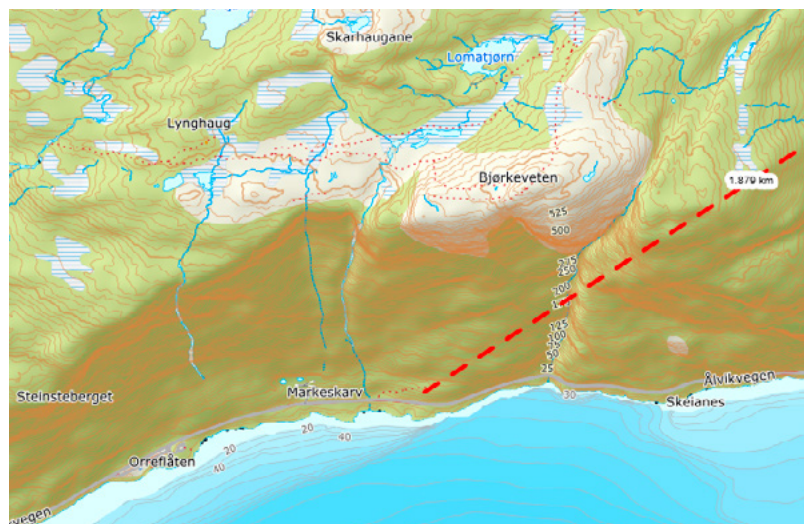
Figur 1: Eksempel på prosjektark (Fv. 79 Steinstøberget)