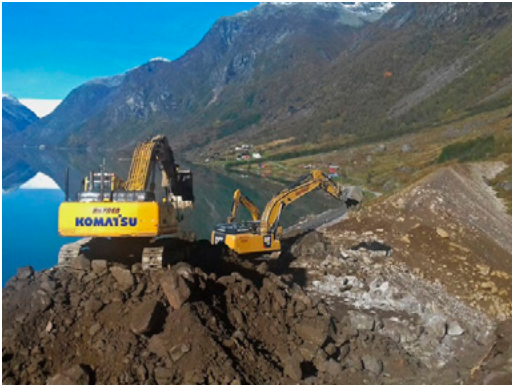
Fv 5641. Bygging av skredvoll ved Veitastrondsvegen.