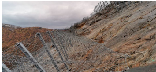
Fv 5398 ved Gullbrå. Støtteforbyggingar i losneområde for snøskred montert i 2020.

Dette er fysiske barrierar som skal hindre at snøskred skal losne. Monteringsarbeida vert utført av mannskap i tau og føregår høgt oppe i fjellsida. Arbeidet er tid- og resurskrevjande. Dette er eit risikofyllt arbeid som ofte krev ein reinsk på forhånd. Tiltaket er ofte effektivt.