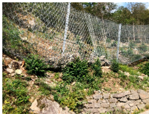
Fv 79. Bildet viser eit fanggjerdar som stoppa eit steinsprang i Granvin i 2019.

Ved nybygging av veg bør ein derimot, så langt det er råd, unngå fanggjerdar til anna bruk enn som arbeidssikring. Fanggjerdar skal ikkje erstatte portalar ved nybygging av veg, men kan eventuelt brukast i ein overgang mot terrenget utanfor portalen.