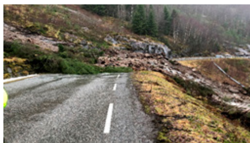
Fv 5406 ved Kallestad bru i februar 2010.

Flaumskred er ein type lausmasseskred som er vanlige i gjel og bekkeløp. Desse skreda består av stein, jord og vatn som går. Desse skreda er vêravhengige og vert utløyst ved intenst regnver og eventuelt ved tilførsel av smeltevatn. I nokre tilfelle kan slike skred komme som følgje av tidlegare skred som har demt opp bekkar eller elvar i terrenget, og der demningen til slutt brest. Flaumskred kan gå gjennom heile året.