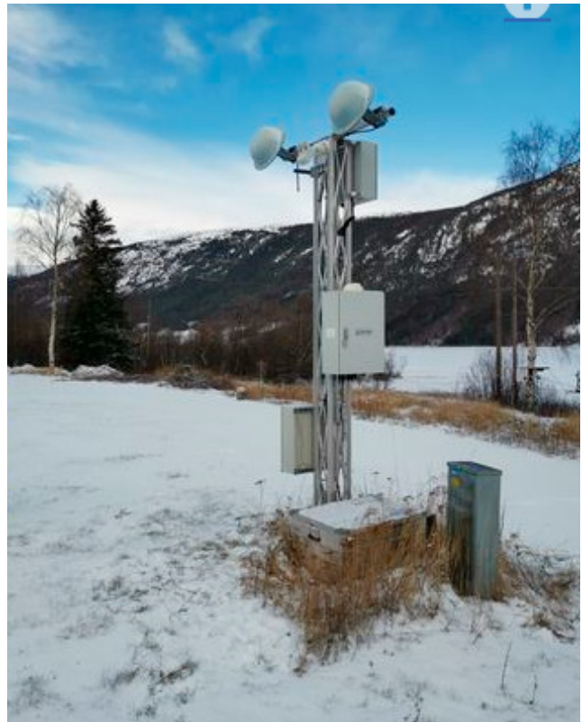
Radar som detekterer snøskred koplatt opp mot bommar langs vegen. Drifting av slike system krev tett oppfølging og årlege ressursar.

I slike anlegg (geofon/radar) følgjer ein med på bevegelsar i terrenget slik at ein kan stenge vegen før skred når vegen. Eit eksempel kan vere varslingsystem med bommar som går ned før snø- eller flaumskred kjem i vegbana. Dette kan vurderast der anna sikring ikkje let seg gjennomføre, til dømes i område der bratt sideterreng ikkje tillèt terrengtiltak (vollar) eller der fanggjerdar ikkje gjev tilstrekkeleg sikringseffekt. Slike anlegg krev kontinuerleg oppfølging og må ha årlege løyvingar for drift og vedlikehald.