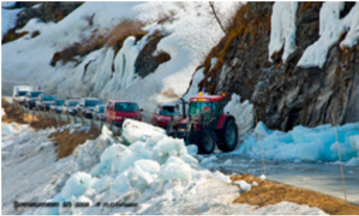
Nedfall av is er eit problem på mange fylkesvegar.

Desse nedfalla går ved mildvêr etter frost. Bakgrunnen er vatn i terrenget som fører til iskjøving, det vil seie oppbygging av is. Størst problem er dette i bergskjeringar og i naturlege bergskrentar nær vegen.