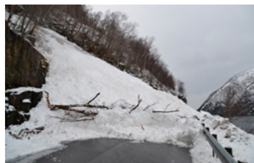
Fv 500 Kovagjelet, Sunndal, Kvinnherad, januar 2015

Snø- og sørpeskred førekjem i bratte i ravinar (gjel) og i dalsider. Vêrforholda gjennom vinteren som temperatur, nedbørsmengder og vindretning er avgjerande for kor høg skredfaren blir. Til dømes gir stort snøfall i kombinasjon med vind auka risiko for snøskred. Sørpeskreda går når snøen er så metta av vatn at den nærmast er flytande. Desse skreda går naturleg nok om vinteren og om våren.