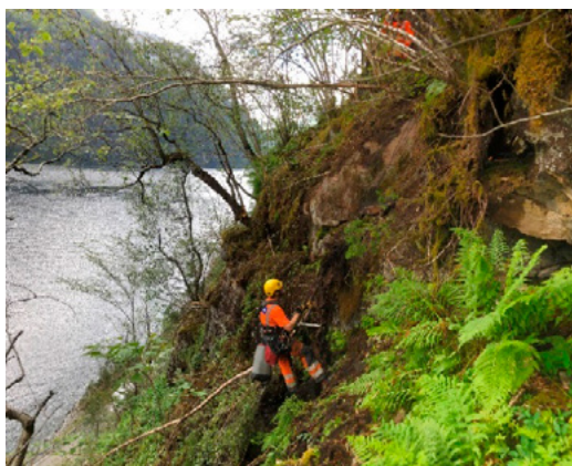
E 16. Fjellreinsk utført i frå tau ved Langhelle.

Reinsk og sikring av lause blokker i terrenget blir utført for å hindre steinsprang, ofte i etterkant av akutte skredhendingar eller i forkant av anna skredsikring, som til dømes oppsett av fanggjerdar. Reinsk av lause blokker kan ha god effekt på kort sikt, men må ofte utførast på ny etter nokre år. I tillegg til reinsk vert det ofte sikra med boltar og nett. Sikringa kan vere effektiv, men den er svært ressurskrevjande og tek tid. Dette er arbeid utført av reinskjelag som arbeider i tau, og med ein betydeleg risiko for arbeidarane som utfører jobben.