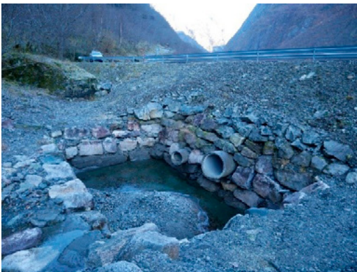
Fv 5623 magasin

Magasin blir brukt for å stoppe mindre snø-, sørpe- og flaumskred. Tiltak vert kombinert med kulvertar eller stikkrenner, og i nokre tilfelle vert det etablert ein fangvoll eller betongmur mellom magasin og vegbane som supplerande skredsikring.