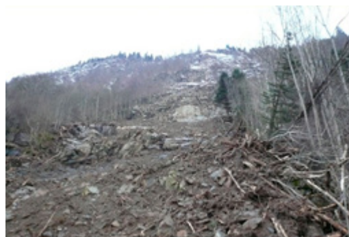
Fv 550 Eikhamrane nord, vestsida av Sørfjorden, 26 desember 2011

Leirskred (kvikkleire) går under marin grense. Det vil seie grensa som avspeglar øvre havnivå i istidas slutfase. Marin grense er på det meste rundt 130 moh i indre strøk av fylket, mens den ved kysten er nokre titals meter. Leirskred er sjeldne i fylket, men det er fleire lokalt ustabile område der det har vore slike skred.