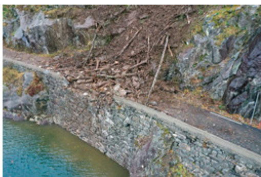
Fv 5374. Steinsprang som har drege med seg jordmassar og tre i Osa i november 2020.

Blokker og stein med eit volum under 100 m 3 som losnar i eit bratt sideterreng er definert som steinsprang. Skredhendingar med volum mellom 100–100 000 m 3 kallast steinskred. Dei aller største, og svært sjeldne, kallast fjellskred (>100 000 m 3 ). Bergart, lagdeling og oppsprekking påverkar stabiliteten i fjellet. Frost- og rotsprenging jekkar gradvis ut blokker og stein. Utløysande faktorar er ofte mildver i etterkant av frostperiodar eller i samband med kraftig regnver.