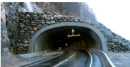
Fv 572. Portal ved Torgilsberg tunellen

Tunnelmunningar er ofte skredutsette og det vert derfor bygd betongkonstruksjonar tett opp mot berget. Desse kan dimensjonast for å tåle store belastningar. I Vestland fylke er svært mange tunnelar og dermed tunnelportalar. Portalane av eldre årgang er ofte altfor korte og for svake. Portalar etter dagens standard er derimot oftast robuste og effektive. Mange stader er det svært krevjande å bygge portal sidan dette ofte inneber full reinsk og gjerne eit fanggjerdje for å sikre arbeidarane som byggjer portalen.