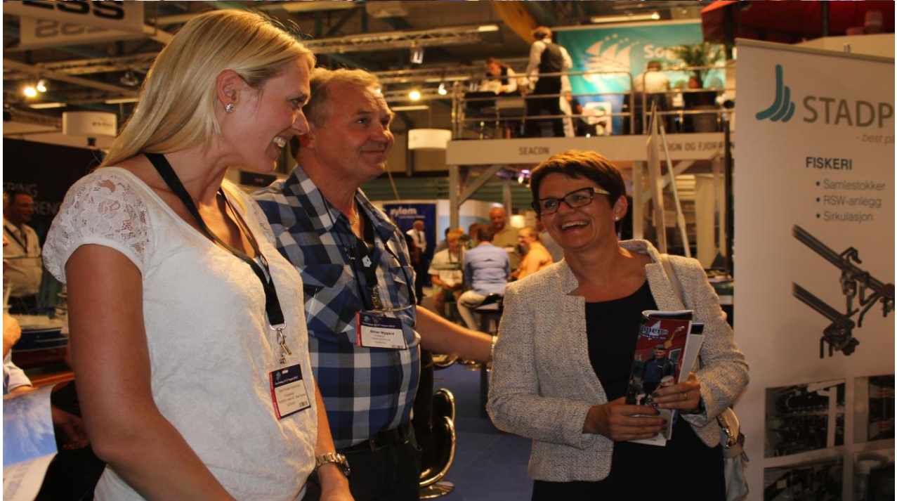
Fiskeri- og kystminister Lisbeth Berg-Hansen besøkte Stad skipstunnel-portalen på Fiskerimessa i Trondheim 14.-17. august-2012.

Fiskeri- og kystministeren la frem rapporten «Verdiskapning basert på produktive hav i 2050», fra en arbeidsgruppe oppnevnt av Det Kongelige Norske Videnskabers Selskab (DKNVS) og Norges Tekniske Vitenskapsakademi (NTVA)(2012). Denne rapporten spår en seksdobling av den norske sjømatnæringen og en omsetningsverdi på 550 milliarder i 2050 (90 mrd. i dag). En slik formidabel vekst vil by på mange utfordringer, ikke minst innen for infrastruktur og transport. Det vil føre til økt skipstrafikk over det utsatte Stadhavet, og dermed også styrke den samfunnsøkonomiske nytten av en skipstunnel. Prosjektgruppa ba derfor SINTEF Bedriftsutvikling regne på den samfunnsøkonomiske nytten hvis denne spådommen inntreffer. En seksdobling av fiskeri- og havbruksnæringen mot 2050 betyr snaut 4,5% vekst per år og vil bety en samfunnsøkonomisk nytte på mellom 1 og 2 mrd. for prosjektet Stad skipstunnel.