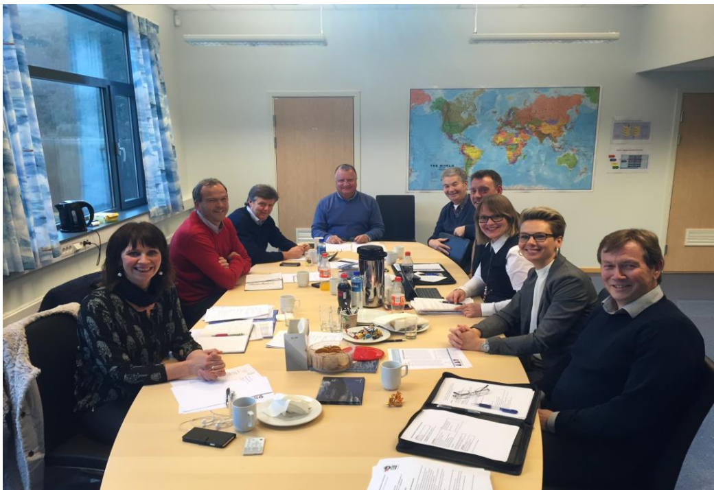
Styringsgruppemøte 5. november 2015