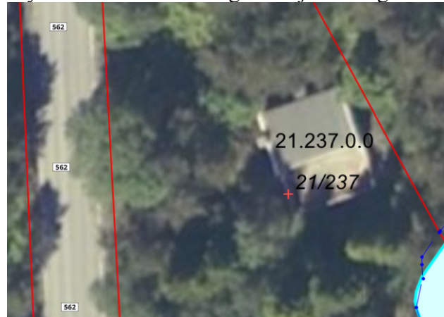
Flyfoto fra 2008 viser ingen avkjørsel/veg.