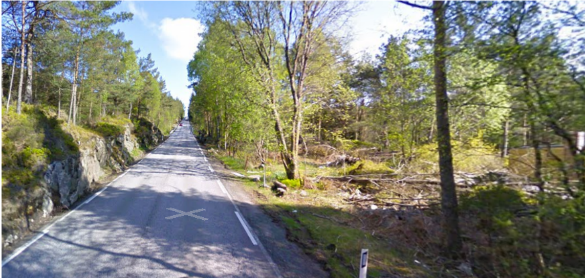
Fig: Google Street View 2009. Det er ikkje mogleg å sjå at det er tilrettelagt for parkering.