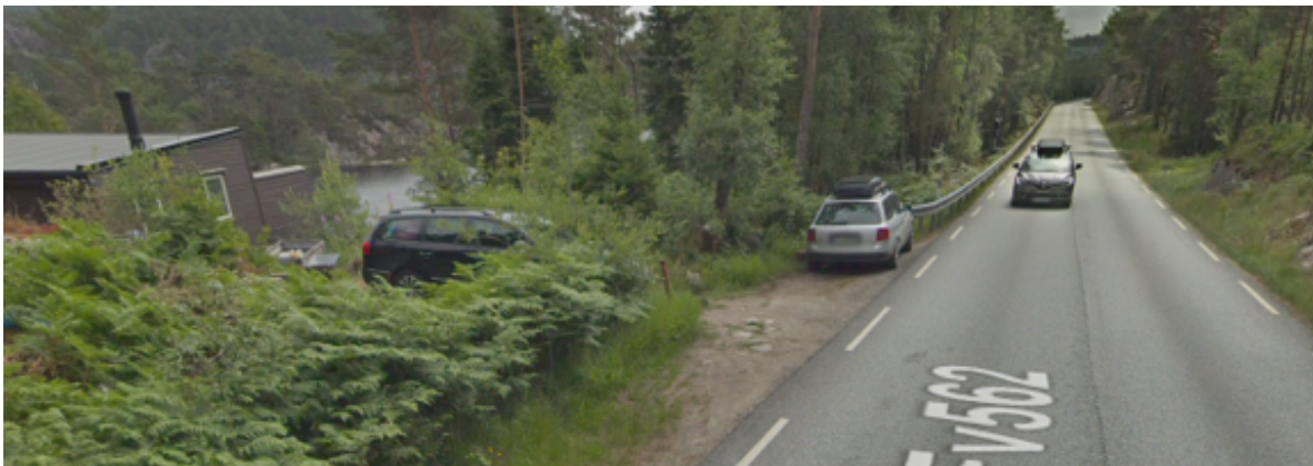
Bilete frå 2018, det er etablert ein form for parkering, samt at det vert parkert langs veg..

Det er ein samanheng mellom talet på avkøyrslar og transportfunksjonen til offentlege vegar, di fleire avkøyrslar di meir vert transportfunksjonen redusert. Like nord for avkøyrsla det er søkt om, er det regulert eit større deponiområde, med eige avkøyringsfelt for større køyretøy. Avkøyringsfeltet er planlagt fordi det er høgt fartsnivå og større køyretøy treng lengre strekning for å redusere farta tilstrekkeleg. Kryssområde inn til deponiet er regulert nord for dette igjen. Deponiområdet er under utvikling og er ikkje ferdigstilla eller i drift. Det vil likevel seie at det er under etablering fleire avkøyringspunkt og kryss på ei kort strekning av fylkesvegen. Vi meiner det er relevant å sjå på utviklinga i området samla og finne dei beste trafikale løysingane, framfor at det skal etablerast enkeltavkøyrslar på denne strekninga.