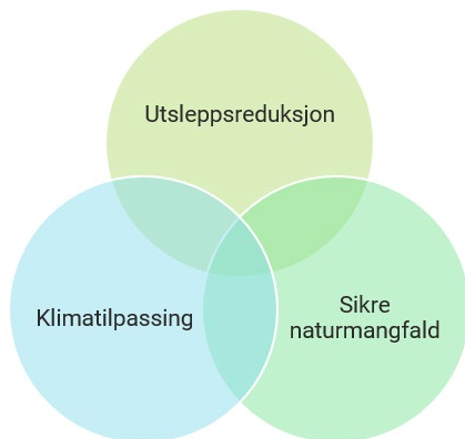
FIGUR 2: HOVUDOMRÅDA I KLIMAOMSTILLING

Utgangspunktet for arbeidet baserer seg på at vi i Vestland arbeider med klimaomstilling som ei samfunnsendring der vi både reduserer klimagassutsleppa frå Vestlandssamfunnet, samt tilpassar oss til dagens og framtida sitt klima. Ein del av arbeidet med redusert klimagassutslepp er å ha eit fokus på karbonbinding, både gjennom opptak og lagring i skog og jord, samt utarbeiding av ny teknologi. Nye tiltak må sjåast i samanheng for å lukkast med ei berekraftig utvikling.