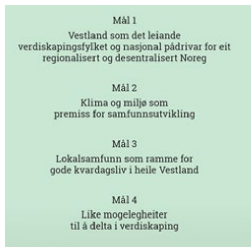
FIGUR 1: MÅL I UTVIKLINGSPLAN FOR VESTLAND 2020-2024

Skal vi lukkast må vi inkludere klimaarbeidet i alt vi gjer. Å lukkast med klimautfordringane skal også bidra til at vi lukkast med andre omsyn, m.a. berekraftige næringsutvikling, mattryggleik, naturmangfald, redusere klimarisiko, og bidra til gode levevilkår og livskvalitet. Vestland skal leie vegen mot det gode, berekraftige og trygge nullutsleppssamfunnet.