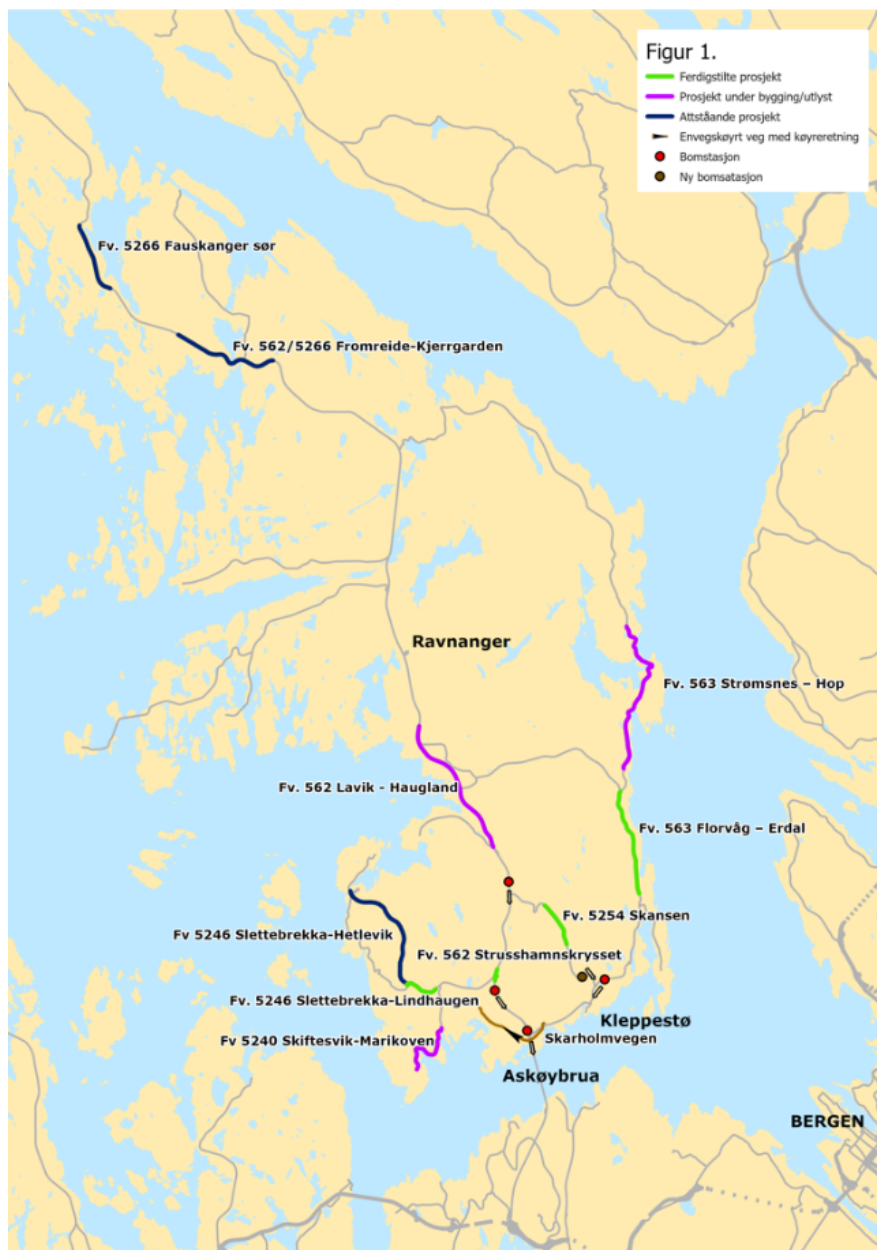
Figur 2 Kart som viser prosjekta i Askøypakken og bomstasjonar