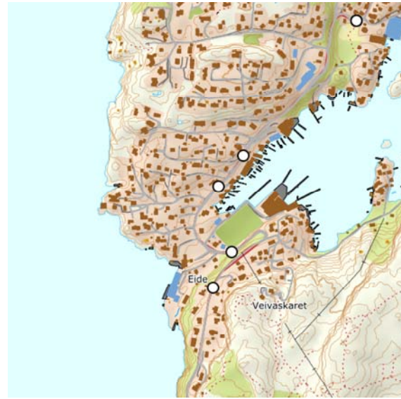
NVDB - ulykker (1000m x 1000m)