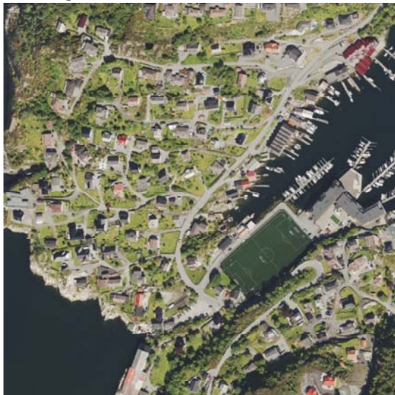
Geonorge - Ortofoto (500m x 500m)