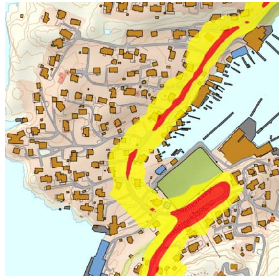
Støyvarselkart (T-1442) (500m x 500m)