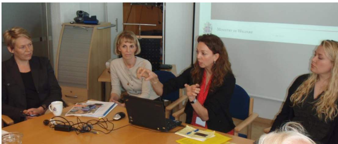
Frå møtet med Velfærdsministeriet.

Ein oppmoding frå Island var at eldreråda bør jobbe meir med konseptet kultur og helse, og det tek råda med seg vidare.