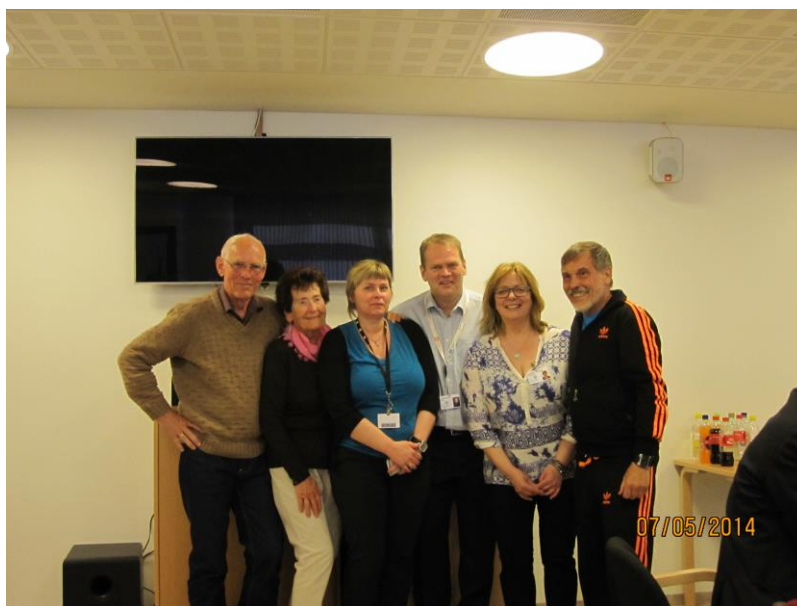
Leiarane i fylkesledreråda saman med leiar for Mørk og dei to sjukepleiarane som deltok på rundturen.

Fylkeseldreråda takker alle for varm velkomst og gjestfrihet. Alle steder vart vi møtt med smil og godt førebytte fagfolk. Studieturen gav godt faglig utbytte og Islands natur og kultur gav studieturen ekstra utbytte og oppleving.