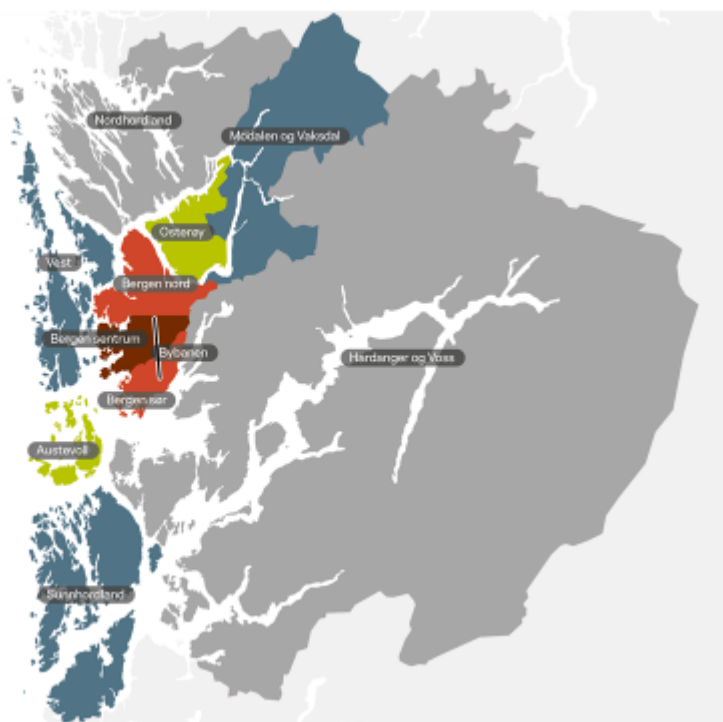
Figur 1 Geografisk oversikt over inndelinga i anbodsområde for buss i Hordaland.

Når det gjeld utarbeiding av miljøprofil og krav til materiell i framtidige bussanbod for Vest (Sotra, Askøy og Øygarden), Austevoll og Osterøy, ønsker ein mest mogleg oppdatert kunnskap om dei teknologiske moglegheitene til kvart anbod. Ein må også ta høgde for at føresetnadene knytt til mellom anna omfang av produksjonen, type transport og geografi er ulike.