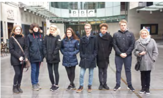
International English students at BBC Broadcasting House in London.