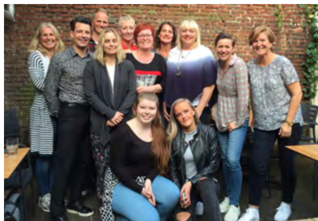
Representatives from Pluscoach, Mot Askøy, and Hordaland County Council.

Part of the programme in the Netherlands was also a visit to Studio Moio, where early school leavers work on social innovation projects. Studio Moio visited Impact Hub in Bergen and talks about future project cooperation have started. Askøy municipality also plans to establish a host project for EVS volunteers.