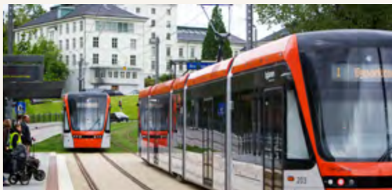
Bergen Light Rail

UITP is a good arena to gain knowledge and network for development of public transport. The organization has different working groups. For Hordaland the groups for Light rail and for Trolley busses are of particular interest. http://www.uitp.org/