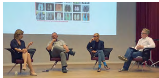
Finally, the library managers from Oslo, Stockholm and Aarhus discussed what will be the 2020 challenges for libraries.

In total 155 participants from Norway, Sweden and Denmark were gathered in Bergen, and found the city bathing in sunshine. The conference is named after the city of Halmstad in Sweden, where it was first organized by Halland County Library in 1991. This year it was organized by Hordaland County Library in cooperation with Bergen Public Library, Kultur Halland, Mölndals Public Library, Aarhus Municipality Libraries, with financial support of the National Library and Hordaland County Council.