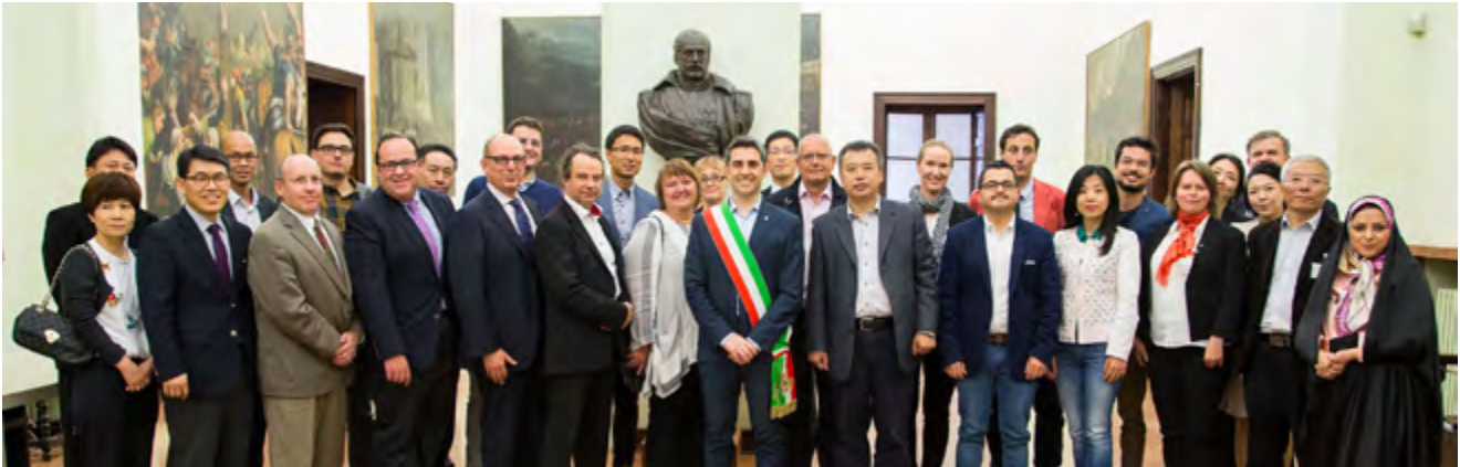
Mayor of Parma Federico Pizzarotti and visiting delegats from other UNESCO cities of gastronomy.