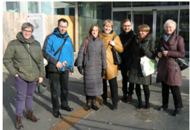
The delegation from the University of Lodz

and infrastructure, and visited both Bergen Light Rail and the new charge station for hydrogen cars. Also the conditions and infrastructure for electric cars in Hordaland were presented.