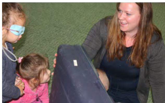
Distribution of gifts among children in Moldova by Rebecca Vangsnes from Os Upper Secondary School.