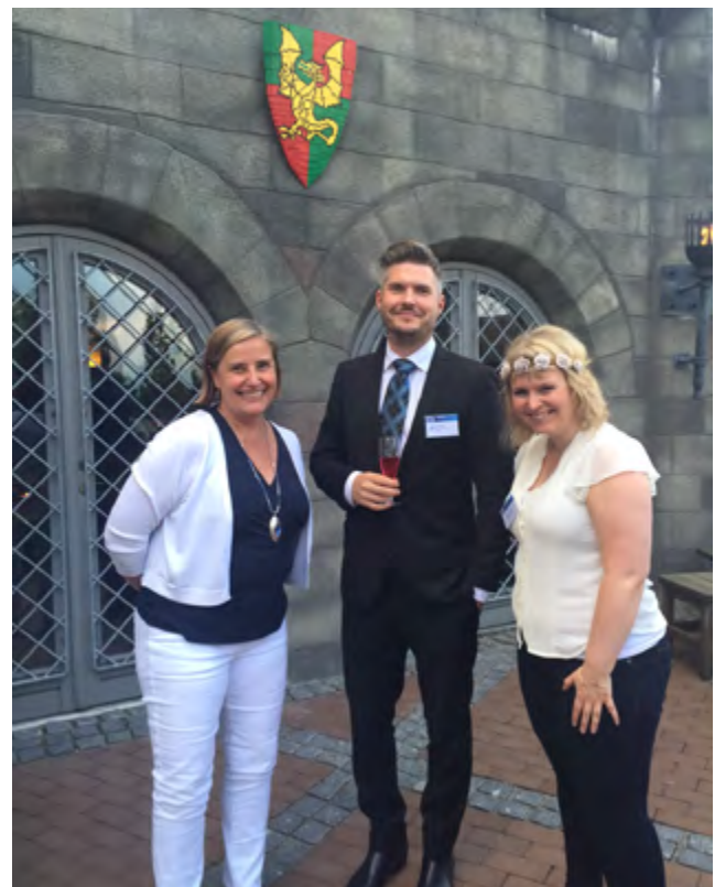
The Hordaland secretariat wishes to thank everyone for all cooperation the last two years, and good luck with the work ahead!

Examples of best practice, “North Sea Region in numbers” statistical document and the updated action plan will be added as addendums to the strategy paper.