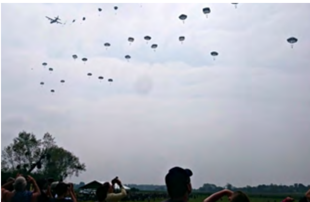
Military and historic reconstruction of parachutists on D-Day in La Fièvre, near Sainte-Mère-Église, Normandy.

Hordaland County Council was one of the financial contributors to the workshop. Two Norwegian students from Bergen Academy of Art and Design made photographs of war memorials which they will use for an exhibition in the future.