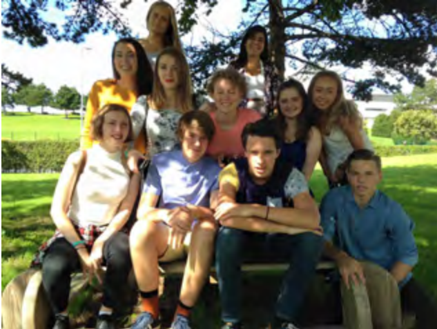
The Hordaland Class in France 2015–2016