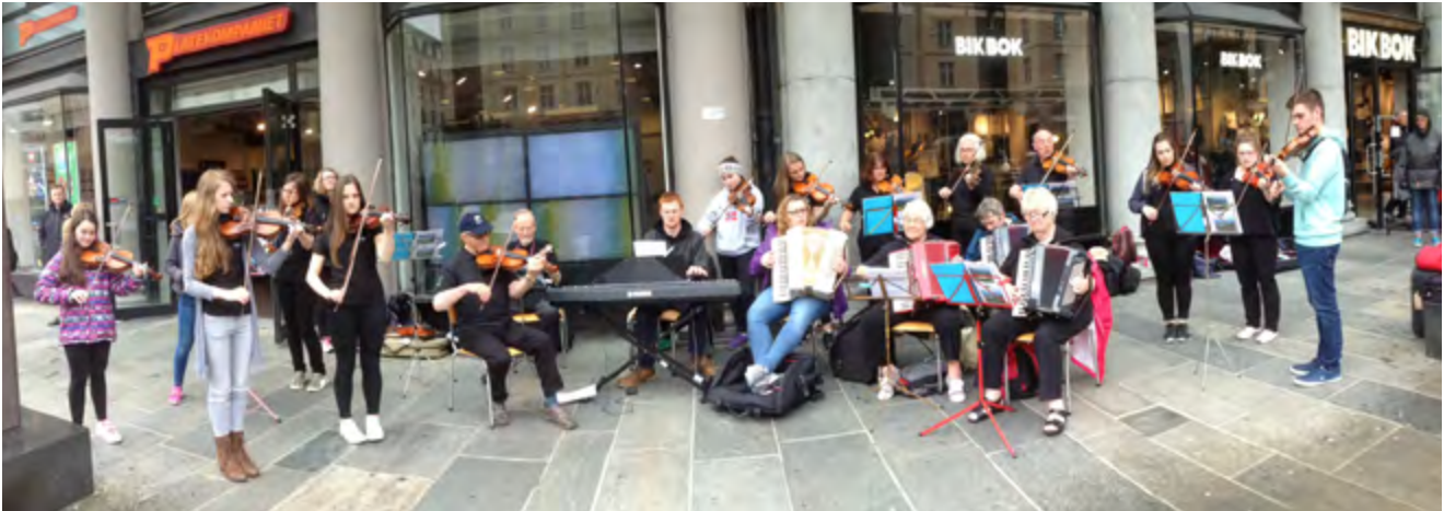
West Mainland Strathspey & Reel Society from Orkney Islands, performed in the heart of Bergen, at Torgallmenningen.