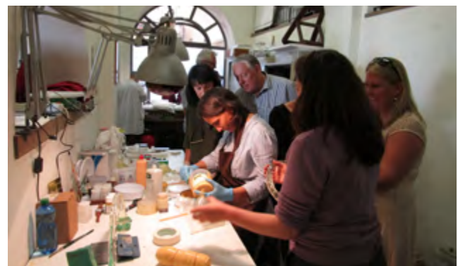
The Odda delegation observes the restoration of a chandelier.