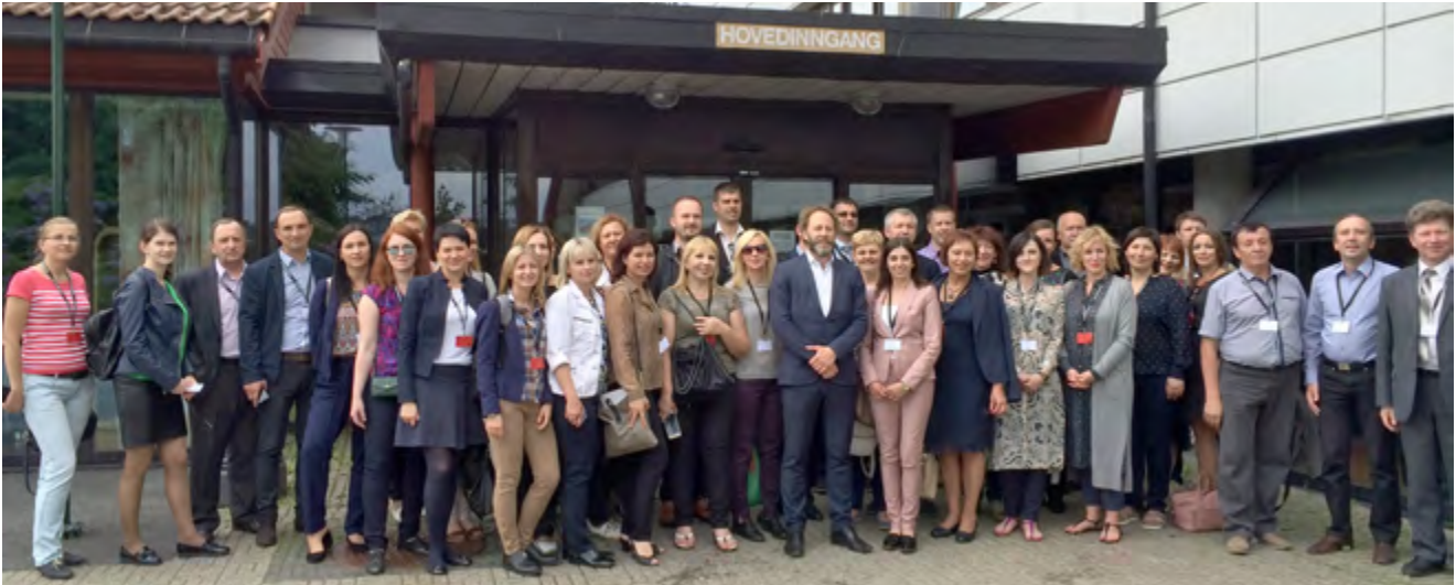
The Lithuanian delegation together with representatives from Hordaland County Council and Fjell Municipality.