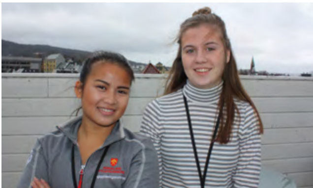
Apprenticeship placement at a German University

administration and the daily routine of the offices, as well as experiencing first-hand how a typical work day is for a German apprentice in Public Administration.