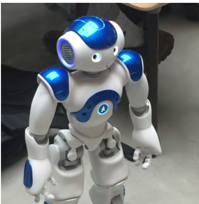
Healthcare for the future

In one of the projects, a group of teachers from Slåtthaug Upper Secondary School visited a childcare centre, a school and two nursing homes in Spain to gain in-depth knowledge about "Active Care", and to learn more about how to incorporate this concept into the professional training of future healthcare workers. The project provided opportunities to see how active care was embedded into the overall treatment scheme in the different institutions they visited.