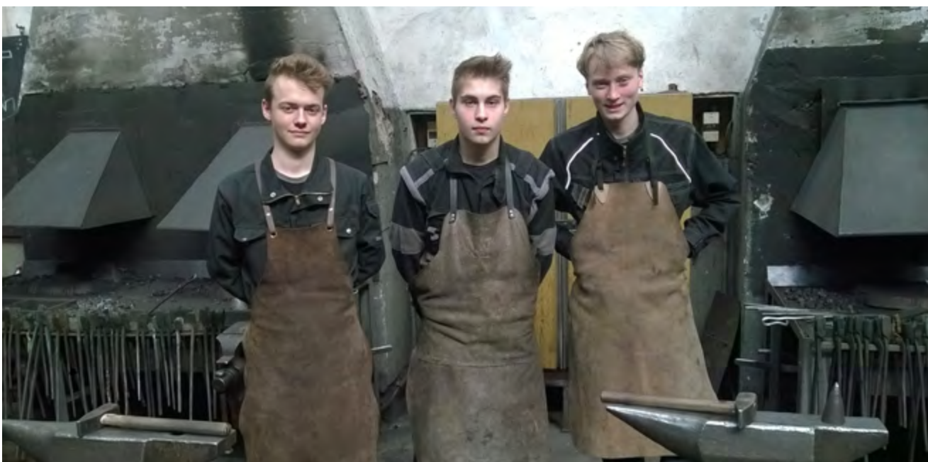
Blacksmith students in the Czech Republic

The students have learned about traditional and historic developments and practices related to the blacksmith and farrier trades. The students had the opportunity to try different techniques and work with materials they would not have had access to in Norway. They have experienced their trade from several different aspects, and have participated in systematic work where they have followed projects from start to finish, made sculptures and various other products, as well as restoration work and surface treatment. Another new experience