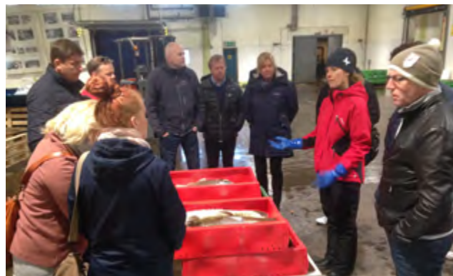
Competence development for Norwegian fishmongers in Sweden

Many stakeholders participated in this Erasmus+ financed mobility project: Fish Me, Fiskekroken Sjøfisk, Knutstad Holen, Snorre Seafood, Fjellskål Fisketorget, Hav Fisk & Skaldyr, HJ Kyvik, Fiskekompaniet, Sjømathuset, Opplæringskontoret for fiskerifag i Hordaland, Hordaland fylkeskommune, og Matarena – Smak av kysten. http://www.smakavkysten.no/