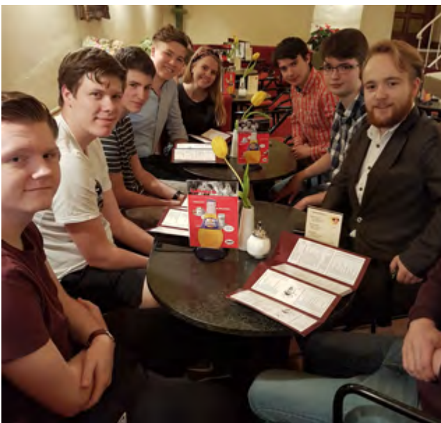
Happy Electricity and Electronics students from Hordaland, celebrating their final exam at a cafe in Erfurt.